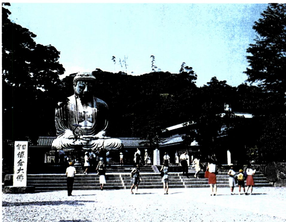
Ο Βούδδας Αμιντά της Καμακούρα (κοντά στο Τόκιο). 13ος αι. μ.Χ.