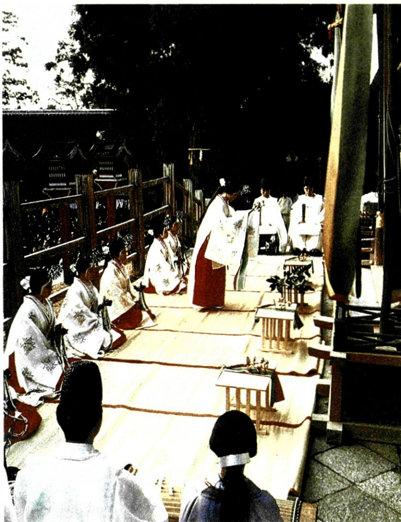
Σίντο: Λατρεία των Κάμι.

Στην ιαπωνική θρησκεία, όπως και στην κινεζική, υπάρχει ένα πάνθεο που αποτελείται από τα θεία όντα του Σιντοϊσμού και του Βουδδισμού. Σ' αυτά απευθύνονται, όπως και στην Κίνα, ανάλογα με τον τομέα που εξουσιάζουν. Π.χ. ο μποντισάτβα Τζίζο, που προστατεύει τα παιδιά στον άλλο κόσμο, από την πλευρά του Βουδδισμού, ή η θεότητα της γονιμότητας Ινάρι, που προάγει το κέρδος και την ανάπτυξη, από την πλευρά του Σιντοϊσμού, είναι μεταξύ άλλων ανάλογων όντων πολύ δημοφιλείς σε όλη τη χώρα.