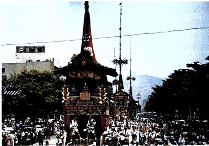
Ματσούρι (σιντοϊστική γιορτή). Μικρά ομοιώματα ναών ή, όπως εδώ, άρματα, περιφέρονται στην πόλη προς τιμή του κάμι.