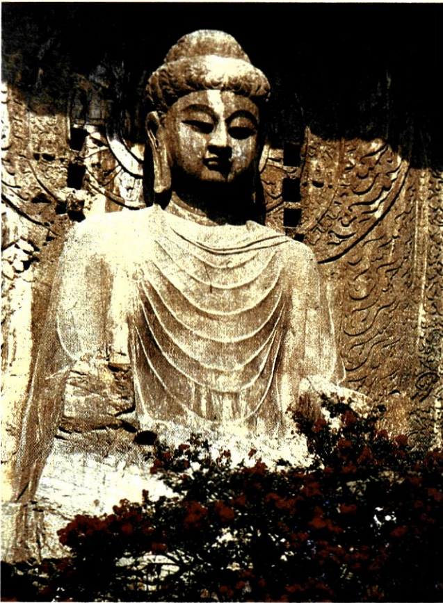
Κολοσσιαίος Βούδ- δας στο Λούγγ-μεν Κίνα. Παριστάνει τον κεντρικό, απόλυτο Βούδδα 7ος αι. μ.Χ.