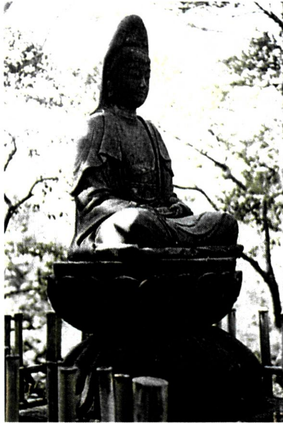
Η μποντισάτβα Κάννον (Γαπωνία).