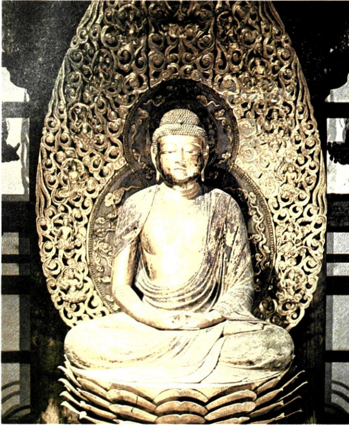
Ο Βούδδας Αμι- ντά (Ιαπωνία, 11ος αι. μ.Χ.).