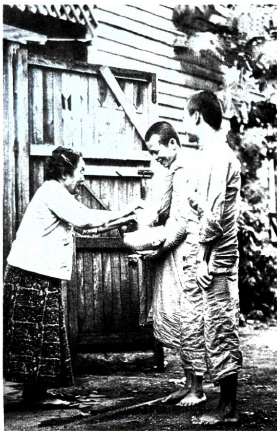
Ταϊλάνδη. Η καθημερινή επαιτεία της τροφής των μο- ναχών.

α. τα πάντα δίνουν την εντύπωση ότι διαρκούν, ενώ στην πραγματικότητα μεταβάλλονται συνεχώς. Δεν αποτελούν «όντα» αλλά μάλλον φευγαλέες διαδικασίες.