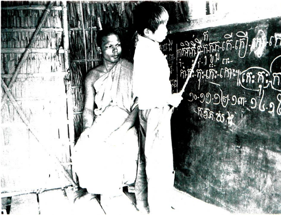
Ταϊλάνδη: ο μοναχός ως δάσκαλος.

Ο Χιναγυάνα διατείνεται ότι η διδασκαλία του ταυτίζεται με εκείνη που ανέπτυξε ο ίδιος ο Βούδδας. Όμως, ο Κανόνας Πάλι καταγράφηκε πολύ αργά, γι' αυτό η αρχική διδασκαλία μόνο κατά προσέγγιση μπορεί να ανασυντεθεί. Πάντως, ο Κανόνας Πάλι περιέχει μια από τις αρχαιότερες συστηματοποιήσεις της. Αυτή είναι η γνωστή ως σχήμα των «τεσσάρων ευγενικών αληθειών». Οι «τέσσερις ευγενικές αλήθειες» είναι: