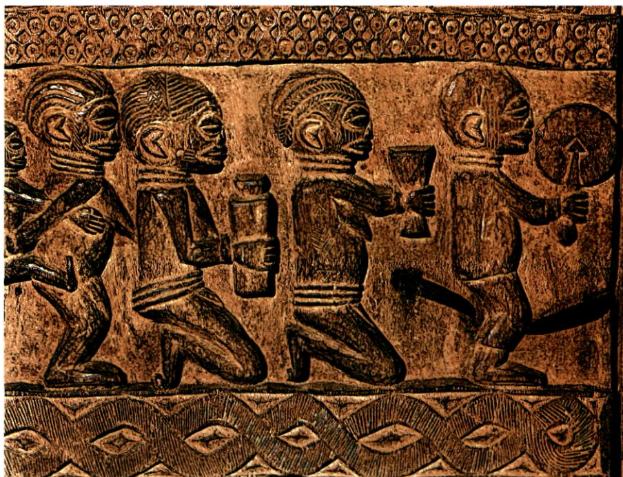
Οι προσφορές αποτελούν τον κυριότερο τύπο λατρείας.

Σήμερα, οι αφρικανικές θρησκείες δοκιμάζονται από την αστυφιλία και την ανάπτυξη του δυτικού τρόπου ζωής. Έχουν επίσης επηρεαστεί από τη συνύπαρξή τους με το Ισλάμ και το Χριστιανισμό. Όμως, ταυτόχρονα παρατηρείται η αναβίωση της παραδοσιακής αφρικανικής θρησκευτικότητας υπό τη μορφή διάφορων νέων θρησκειών.