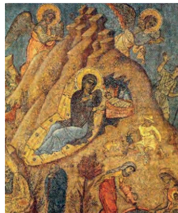
Τοιχογραφία του Φώτη Κόντογλου. Παρεκκλήσι οικ. Πεσματζόγλου, Κηφισιά

Ware, Κάλλιστος, επίσκοπος Διοκλείας (1982). Ο Ορθόδοξος Δρόμος , Αθήνα: Επτάλοφος, σ. 95-96.