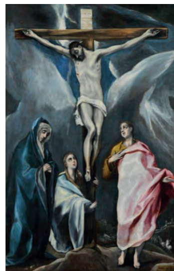
Δομήνικος Θεοτοκόπουλος, Ἡ Σταύρωση. Εθνικὴ Πινακοθήκη, Αθήνα.

Bloom, Anthony, Μητροπολίτης Σουρόζ (2010). Μικρὸ Συναξάρι . Μτφρ. Σ. Κακαλή. Αθήνα: Εν πλω.