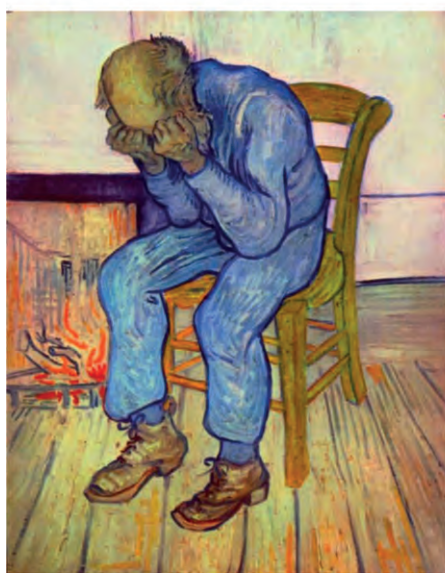
5. Vincent van Gogh (1890). Old Man in Sorrow (On the Threshold of Eternity). Kröller-Müller Museum, Otterlo, Netherlands.