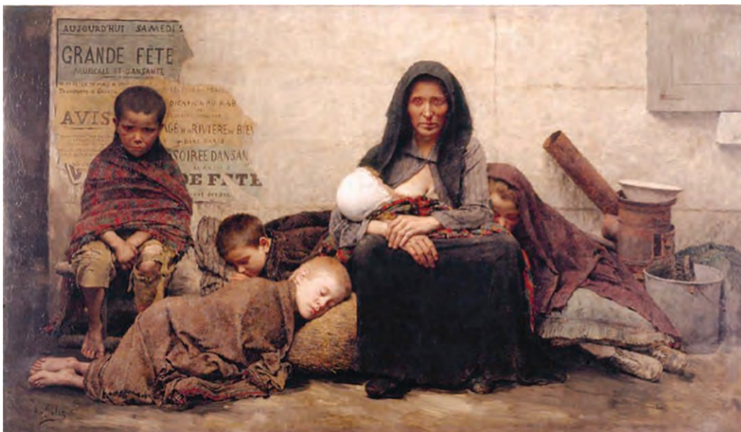
Fernand Pelez (1848-1913), Δίχως Άσυλο ή Οι Απελαθέντες (1883), λάδι σε καμβά, 136 × 236 εκ. Musée des Beaux-Arts de la Ville de Paris, Petit Palais.

α) Ποιο φως εννοείται;, Τι χαρακτηριστικά έχει αυτό το «φως»; β) Ποιος μπορεί πραγματικά να γίνει το φως; γ) Πού καλείται να «λάμψει» το «φως»; δ) Πότε μπορεί να συμβεί αυτό; ε) Γιατί να συμβεί αυτό; στ) Πώς μπορεί να επιτευχθεί αυτό;