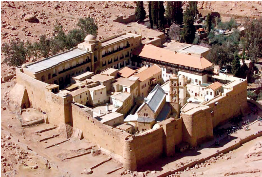
Ιερά Μονή Αγίας Αικατερίνης Όρους Σινά. Η Μονή αποτελεί Μνημείο Παγκόσμιας Πολιτιστικής κληρονομιάς της ΟΥΝΕΣΚΟ.

Δρίτσας, Δ., Μόσχος, Δ., Παπαλεξανδρόπουλος, Στ., Χριστιανισμός & Θρησκευματα , σσ. 213-217.