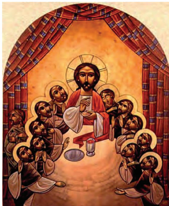
Ο Μυστικός Δείπνος, σύγχρονη κοπτική εικόνα.

35 Ἔτσι θὰ σας ξεχωρίζουν ὅλοι πῶς εἶστε μαθητές μου, ἂν ἔχετε ἀγάπη ὁ ἕνας γιὰ τὸν ἄλλο.