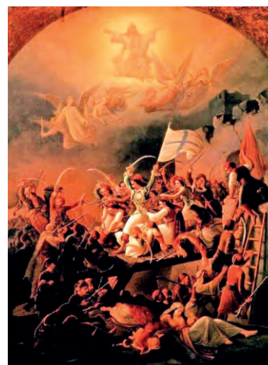
Θεόδωρος Βρυζάκης, Η έξοδος του Μεσολογγίου, 1855