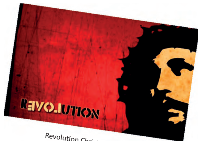
Revolution Christ, by aasemsj