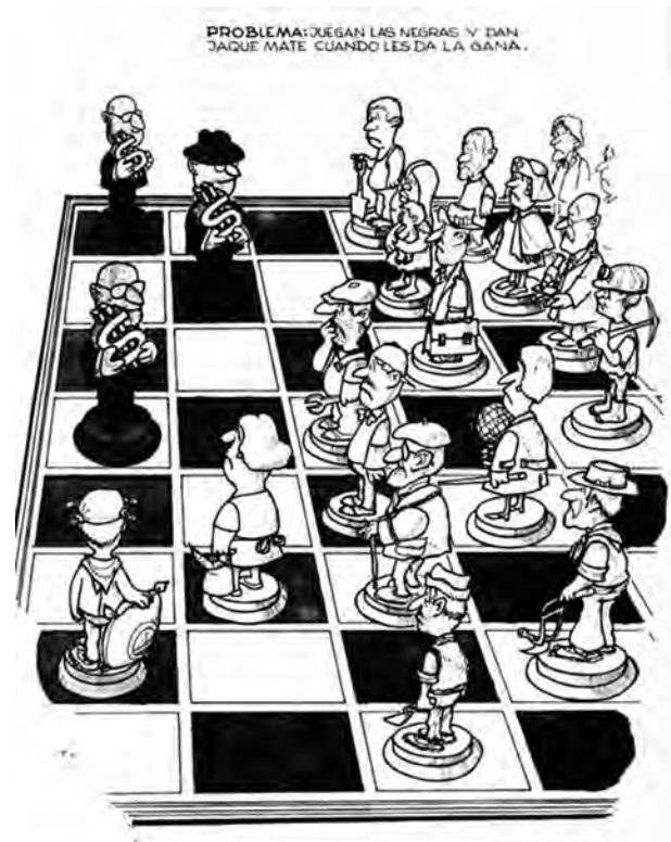
Joaquin Salvador Lavado «Quino», Το σκάκι των τάξεων (Πρόβλημα: Τα μαύρα παίζουν και κάνουν ματ, όποτε τους αρέσει).