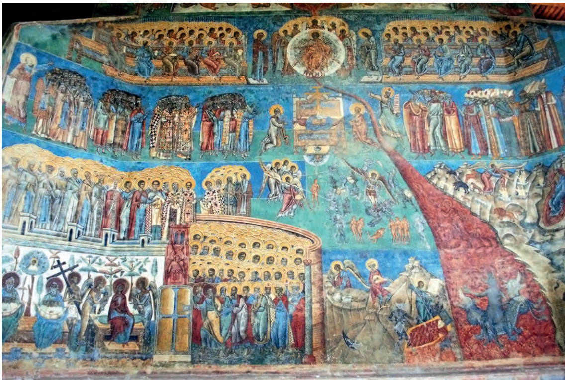
Η Μέλλουσα Κρίση, τοιχογραφία μονής Βορονέτ, Ρουμανία.