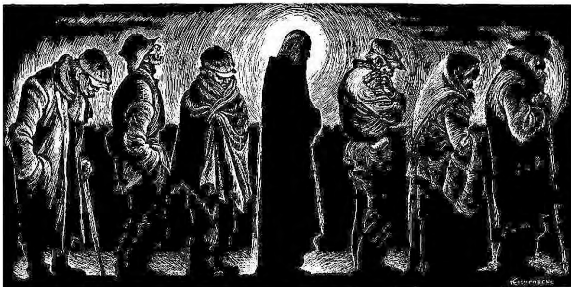
Fritz Eichenberg, Ο Χριστός στο σουσσίτιο (Christ in the breadline)

Αθ. Παπαθανασίου & Μ. Κουκουνάρας Λιάγκης, Ζητήματα Χριστιανικής Ηθικής