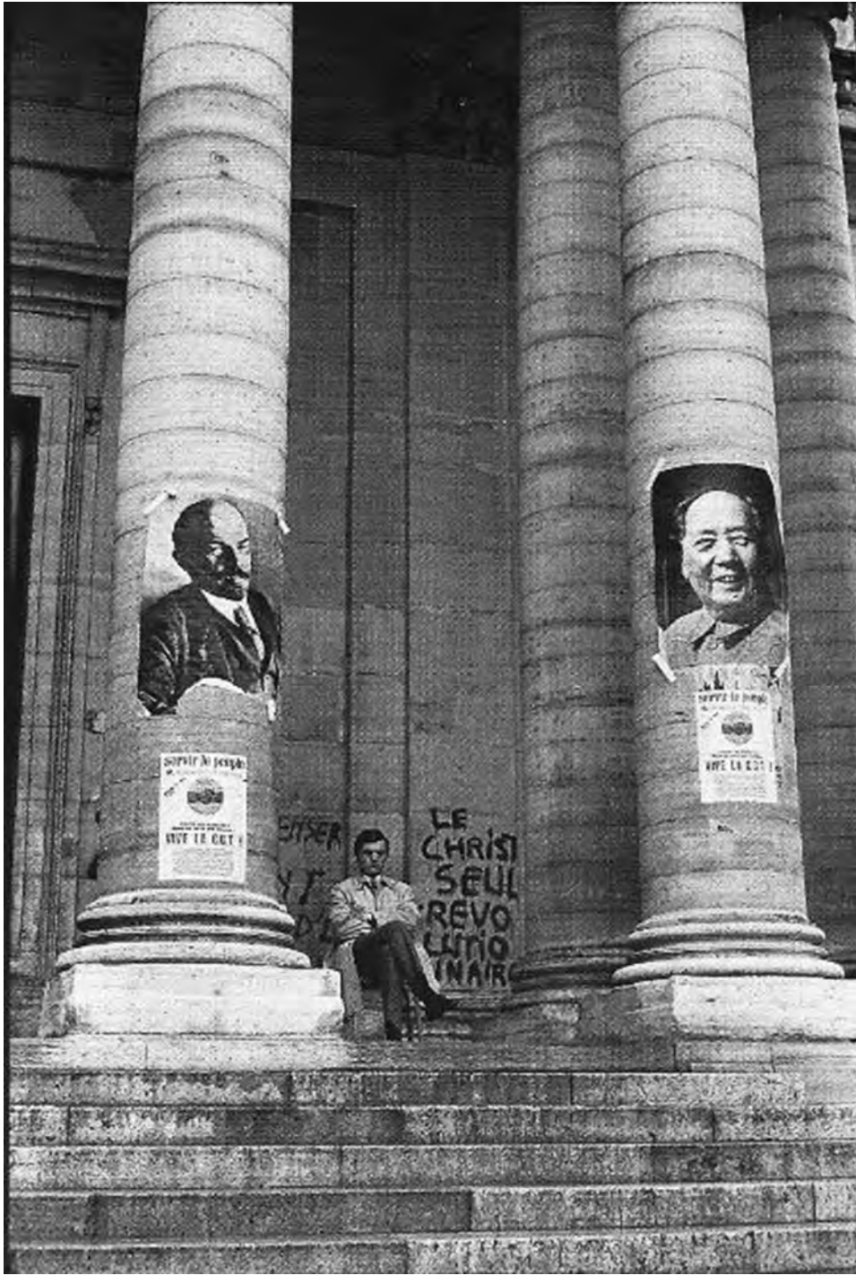
Μάης του 1968, το Πανεπιστήμιο της Σορβόνης υπό φοιτητική κατάληψη. Στον τοίχο το σύνθημα γράφει: «Ο Χριστός μόνος επαναστάτης», φωτ. Ανρί Καρτιέ Μπρεσόν