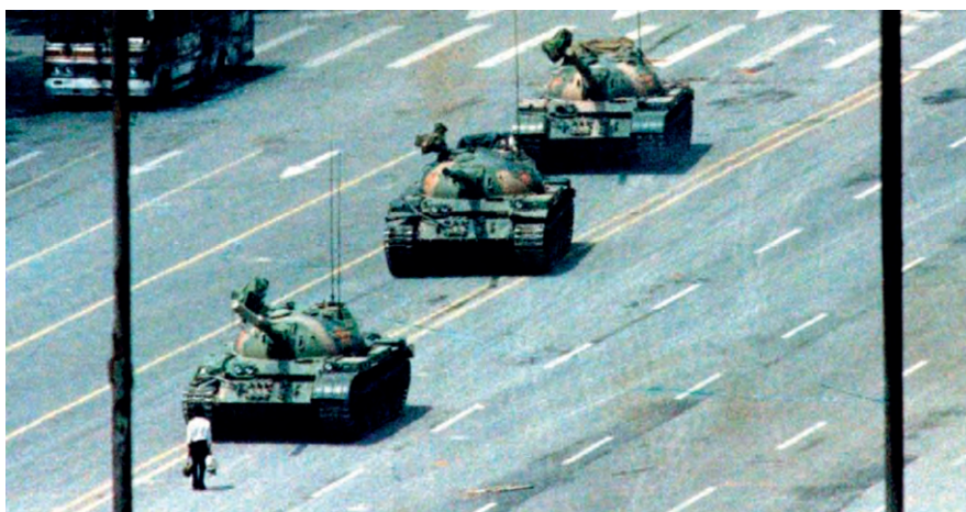
«Tank man», Νεαρός σταματάει τανκς, 1989, Πλατεία Τιεν Αν Μεν, Πεκίνο