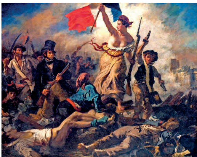
Ευγένιος Ντελακρουά, Η Ελευθερία οδηγεί τον λαό, 1830