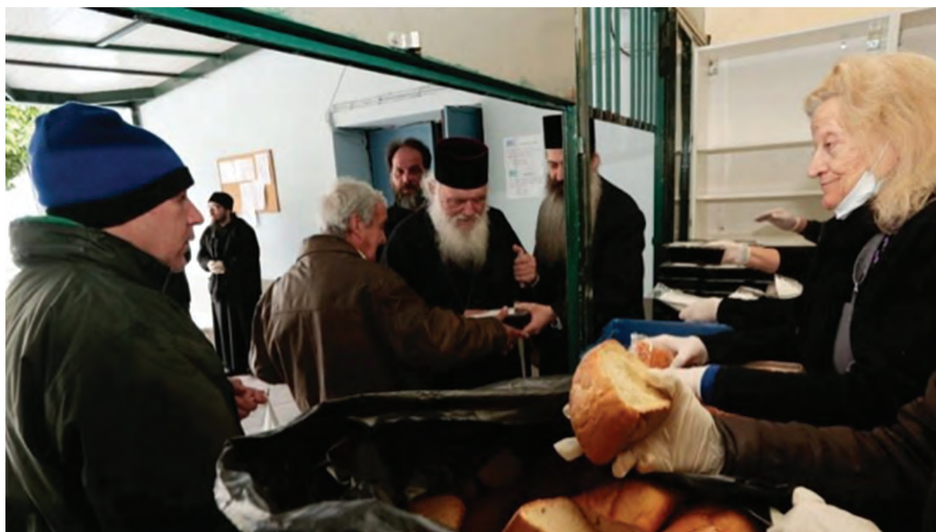
Ο αρχιεπίσκοπος Αθηνών Ιερώνυμος στο κεντρικό συσσίτιο της Αρχιεπισκοπής, στην οδό Σοφοκλέους, Αθήνα, 2019.

Σε ομάδες ή δυάδες ας ορίσουμε ως σκοπό μας να αναζητήσουμε στο διαδίκτυο ή να επισκεφθούμε επιτόπου ένα εκκλησιαστικό ίδρυμα (π.χ. το Γενικό Φιλόπτωχο Ταμείο της Αρχιεπισκοπής Αθηνών ή κάποιο ενοριακό συσσίτιο κ.ά.), μία ιστοσελίδα Μητρόπολης ή ενορίας, συναντώντας το πρόσωπο κλειδί του έργου. Ας ετοιμάσουμε ερωτήσεις και ας επιδιώξουμε να πάρουμε συνέντευξη από το πρόσωπο αυτό, για να μάθουμε περισσότερα σχετικά με το φιλανθρωπικό έργο που αφορά ευπαθείς ομάδες.