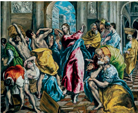
Δομίνικος Θεοτοκόπουλος, Η εκδίωξη των εμπόρων, 1604.

Στη συνέχεια, σε ομάδες, ας αποφασίσουμε ποιες τρεις από τις λέξεις ή φράσεις που γράφτηκαν περιγράφουν καλύτερα την επανάσταση σε προσωπικό και ποιες τρεις σε κοινωνικό επίπεδο.