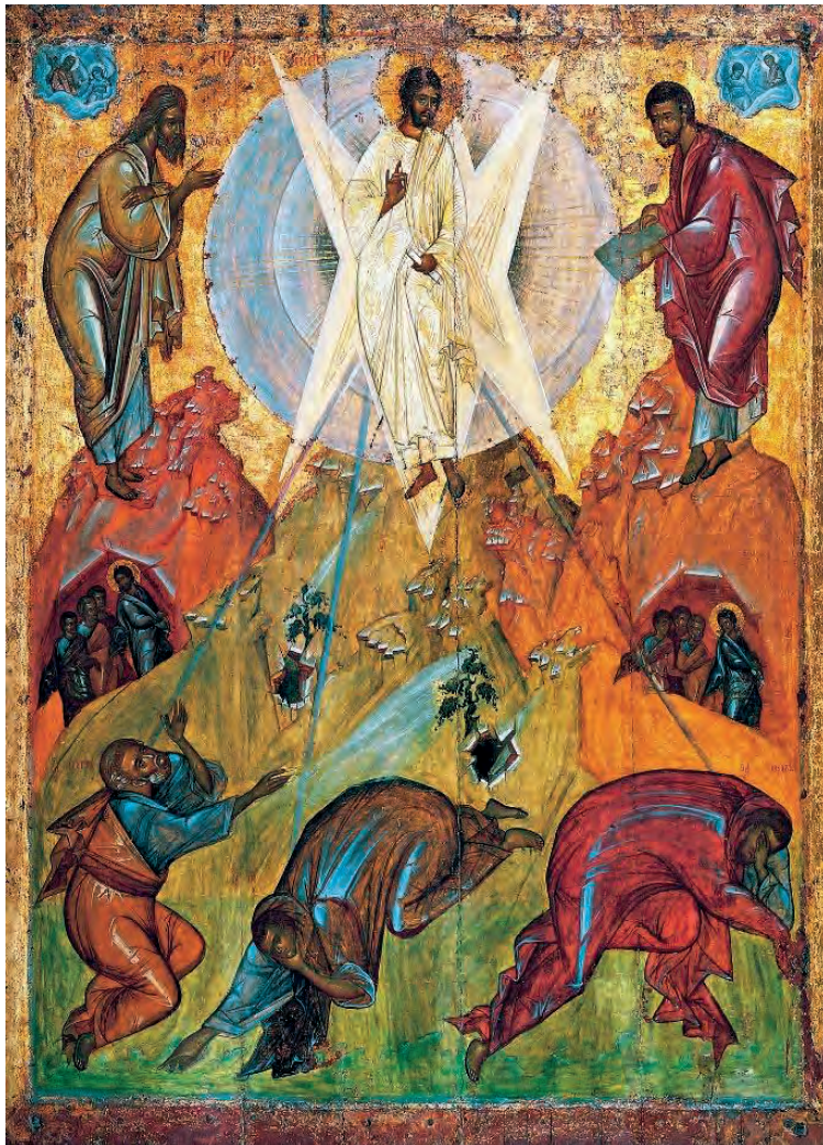
Θεοφάνης ο Έλληνας. Μεταμόρφωση, 15ος αι.

Ας κοιτάξουμε την εικόνα για λίγη ώρα χωρίς να μιλάμε και ας προσέξουμε κάθε σημείο και κάθε πρόσωπο ξεχωριστά. Ας γράψουμε ο καθένας και η καθεμία από εμάς 10 λέξεις ή φράσεις σχετικά με οποιαδήποτε όψη ή πτυχή της εικόνας. Ας επαναλάβουμε το ίδιο προσπαθώντας να βρούμε επιπλέον άλλες 10 λέξεις ή φράσεις.