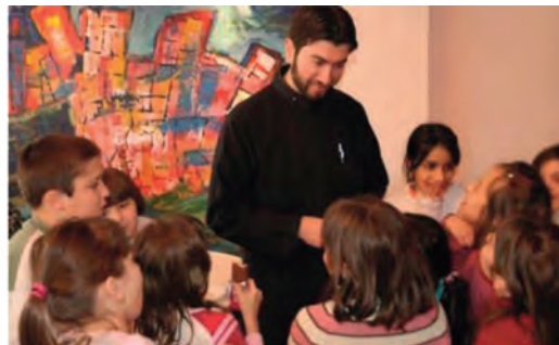
Κορυφαία ΜΚΟ στην Ελλάδα, για το 2016, αναδείχθηκε η «Κιβωτός του Κόσμου».