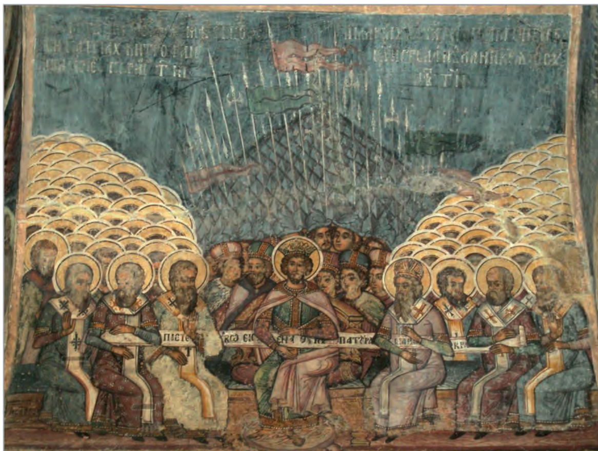
Η Α΄ Οικουμενική Σύνοδος της Νίκαιας. Τοιχογραφία του 18ου αιώνα στον Ορθόδοξο ναό Σταυροπόλεως στο Βουκουρέστι.