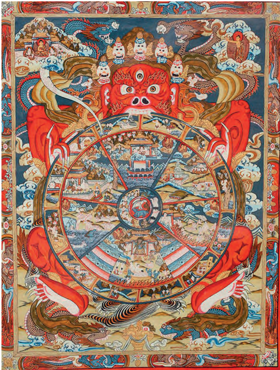
Αναπαράσταση του κύκλου της «σαμσάρα» στον Ινδοϊσμό

Επομένως δεν χάνεται η έννοια του ιστορικού χρόνου μέσα σε μια μυθική ανακύκλωση των πάντων. Η αποκάλυψη του Θεού, λέει η χριστιανική διδασκαλία, κορυφώνεται στην Καινή Διαθήκη, όπου πραγματοποιείται η ζωντανή κοινωνία του ενανθρωπήσαντος Υιού και Λόγου του Θεού με τον άνθρωπο. Έτσι ο Χριστός είναι η αρχή και το τέλος, αλλά και το κέντρο της ιστορίας. Γι' αυτό ο Θεός είναι στο κέντρο της ιστορίας του κόσμου και ευλογεί τον αγώνα του ανθρώπου για κάθε πρόοδο. Στην ευθύγραμμη και ανεπανάληπτη πορεία της ιστορίας καλείται να αγωνισθεί ο άνθρωπος με την τήρηση του θείου θελήματος και την άσκηση έργων αγάπης, για την αναμόρφωση του κόσμου.