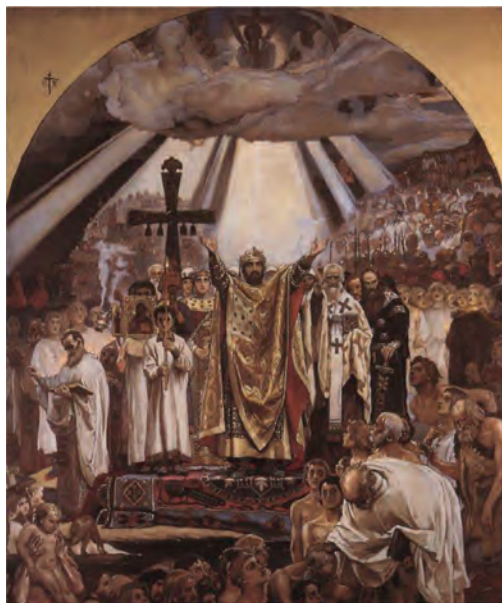
Viktor Vasnetsov, Η Βάπτιση των Ρως του Κιέβου , τοιχογραφία στον καθεδρικό ναό Βλαντιμίρ, 1885-1896.