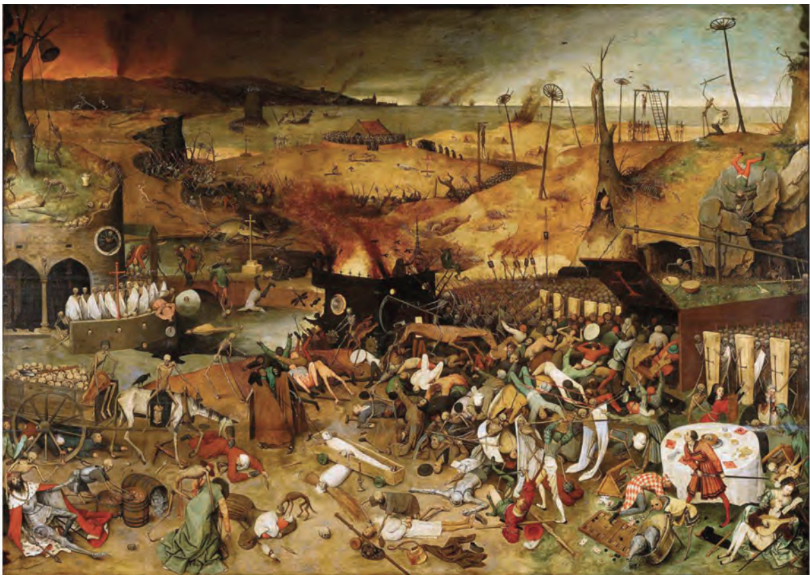
Pieter Bruegel ο πρεσβύτερος, Ο Θρίαμβος του Θανάτου , 1562. Λάδι σε μουσαμά, διαστάσεις 117 × 162 εκ., Museo del Prado, Μαδρίτη.