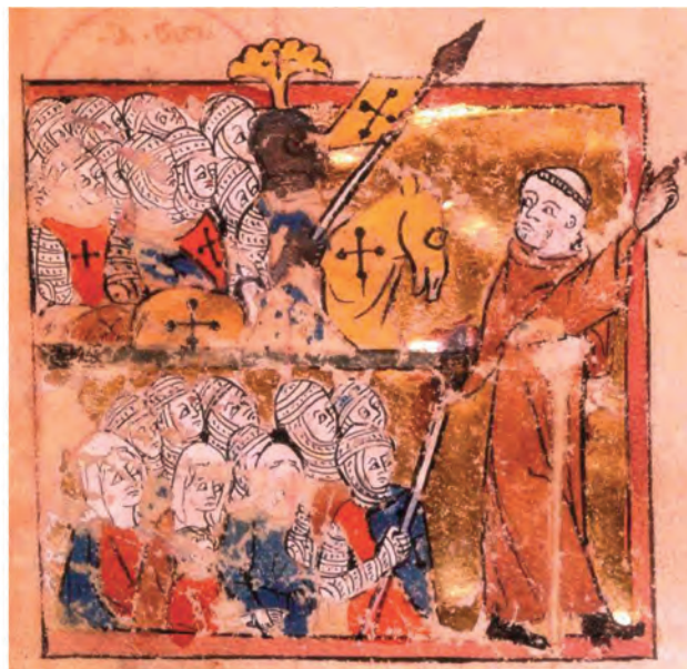
Ο Πέτρος ο ερημίτης καθοδηγεί τη Λαϊκή Σταυροφορία 1096, κατά την Α' Σταυροφορία, μικρογραφία.