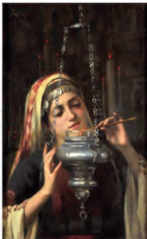
Θεόδωρος Ράλλης (1852-1909), Η Κανδήλα.