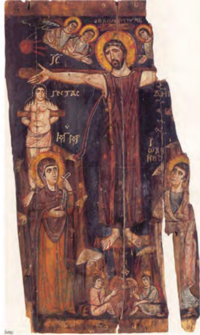
Σπάνια εικόνα της Σταύρωσης (8ος αιώνας). Ιερά Μονή Θεοβαδίστου Όρους Σινά, Αγίας Αικατερίνης.