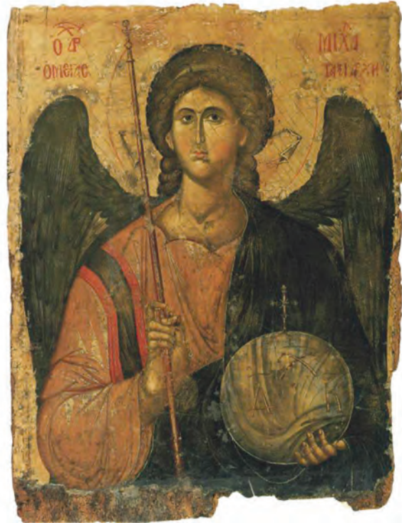
Επάνω: Φίκος, Wasted Love, 2014, graffiti Πειραιάς. Κάτω, αριστερά: Μιχαήλ Άγγελος, Άγγελος με κρηστή- γιο, 1494, Βασιλική San Domenico, Bologna, Ιταλία. Κάτω, δεξιά: Ο Αρχάγγελος Μιχαήλ, φορητή εικόνα, 14 ος αι., Βυζαντινό και Χριστιανικό Μουσείο Αθηνών.