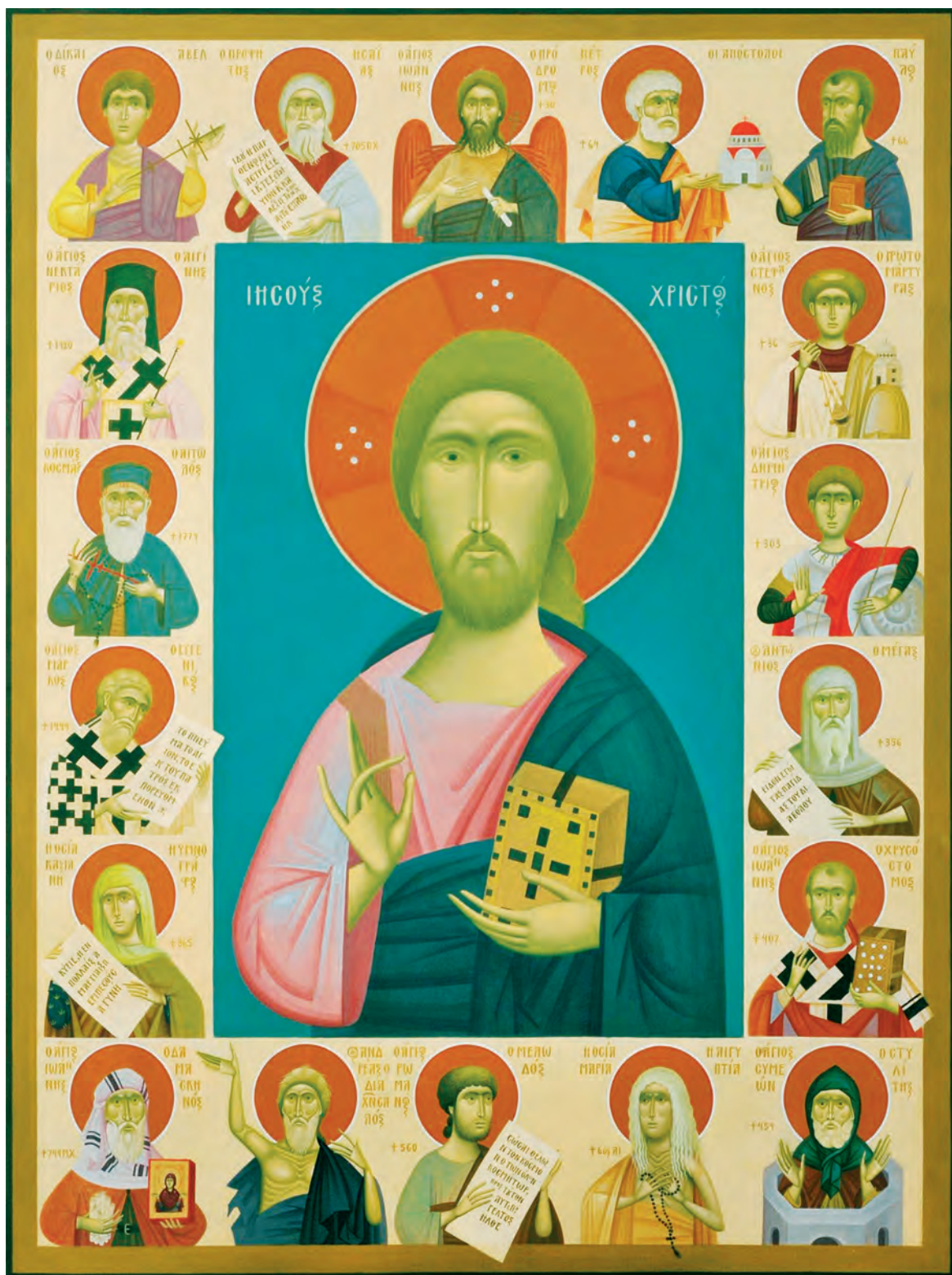
Η Ιστορία της Ορθοδοξίας σε Πρόσωπα. Εικόνα διά χειρός Φίκου, 2012. Αυγοτέμπερα σε χειροποίητο Ιαπωνικό χαρτί κολλημένο σε ξύλο.