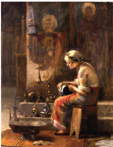
Θεόδ. Ράλλης, Παραμονή Εορτής .

Ζουμπουλάκης, Στ., Η αδελφή μου , Πόλις, Αθήνα, 2012, σελ. 29-31.