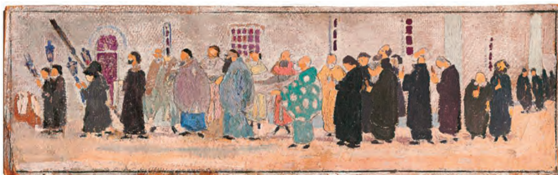
Σπύρος Παπαλουκάς, Λιτανεία, Βημόθυρο, τεύχ. 4, 2010 σελ. 125.

Πίστη έχεις, όταν κάθε σου όνειρο τ' ανάφτεις στο βωμό της τάμα, κι αν κάποιο τάμα σου είναι αδύνατο, προσμένεις να γενεί το θάμα!