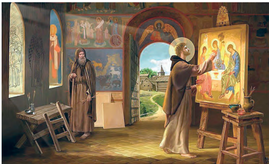
Ο Αντρέι Ρουμπλιόφ, περίφημος Ρώσος ζωγράφος και αγιογράφος (1360-1438), ιστορεί την εικόνα της Αγίας Τριάδας. [Σύγχρονος πίνακας].