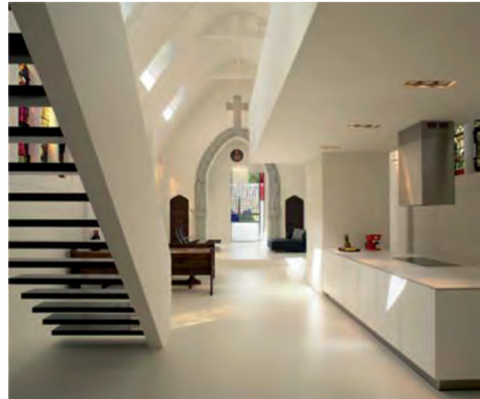
Παλιά καθολική εκκλησία έχει μετατραπεί σε χώρο κατοικίας.

Παπαγεωργίου, Ν., «Η Εκκλησία και η εκκοσμίκευση», Δημοσίευση: 12/6/2007. Από την επίσημη ιστοσελίδα του Οικουμενικού Πατριαρχείου (Ανακτήθηκε 14/5/2017).