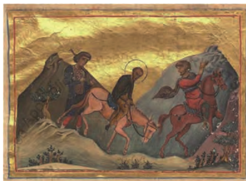
Άγιος Ιωάννης ο Χρυσόστομος στον δρόμο για την εξορία.

Αργυρόπουλος, Α., Το επαναστατικό μήνυμα των Τριών Ιεραρχών , σειρά Έξοδος στην κοινωνία και τη ζωή, Αθήνα, 2009, σελ. 28-30.