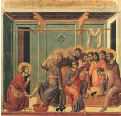
Ντούτσιο ντι Μπουονινσένια, Ο νιπτήρας .