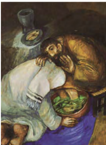
Sieger Koder, Ο Ιησούς πλένει τα πόδια του Πέτρου.