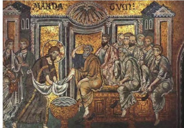
Ιερός Νιπτήρας, ψηφιδωτό. Καθεδρικός Monreale, Ιταλία.