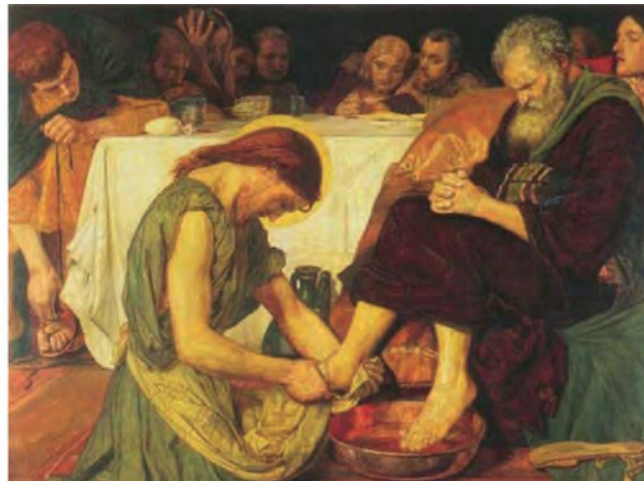
Ford Madox Brown, Ο Χριστός πλένει τα πόδια του Πέτρου, 1851-1856. Πινακοθήκη Tate Britain. Λονδίνο.