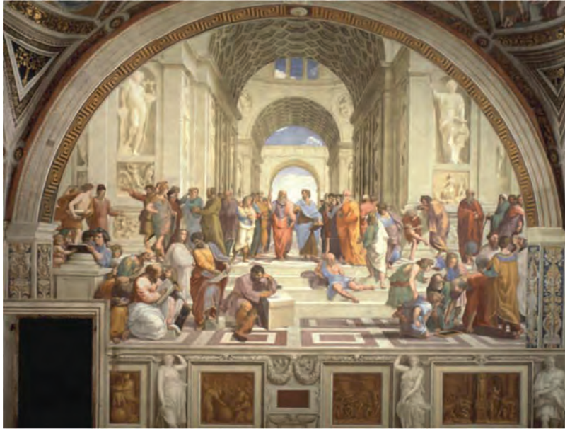
Ραφαήλ (Raffaello Sanzio ή Santi), «Η Σχολή των Αθηνών», 1510-11. Φρέσκο. Stanza della Segnatura, Βατικανό.