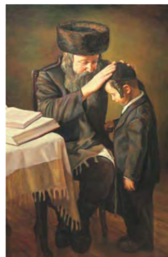
Μπορίς Ντουμπρόβ, Η ευλογία του Σαββάτου . Λάδι σε καμβά.

«Τα έμβια όντα δε ζουν μόνο μια φορά, αλλά αφού μια μορφή ύπαρξης διαλυθεί, κάτι από αυτήν επιβιώνει και μεταβαίνει σε άλλη μορφή ύπαρξης. Δημιουργείται έτσι ένας ατέρμων κύκλος μετενσαρκώσεων (“ Σαμσάρα ”), που διατηρεί συνεχώς τα όντα σε κάποια μορφή ύπαρξης. “ Κάρμα ” σημαίνει πράξη. Οι πράξεις που το ον διέπραξε στην προηγούμενη μορφή ύπαρξης, είναι εκείνες