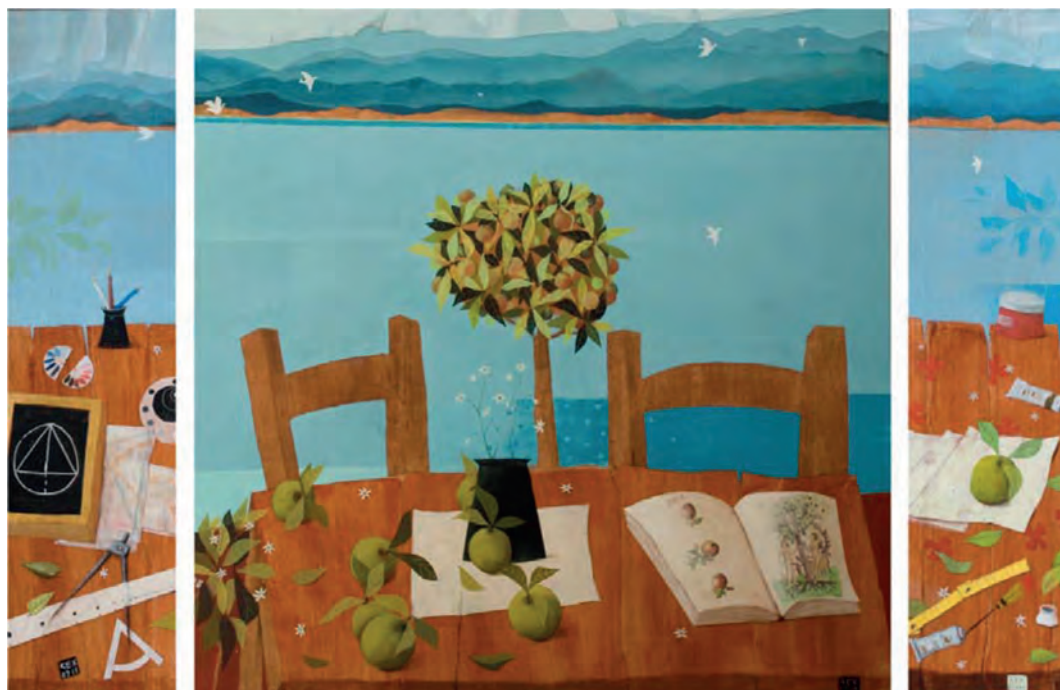
Χρήστος Κεχαγιόγλου, Το τραπέζι του Αδάμ και της Εύας.