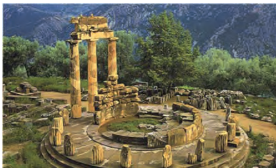
Δελφοί. Η θόλος της Προναίας Αθηνάς.

Δρίτσας, Δ., Μόσχος, Δ., Παπαλεξανδρόπουλος, Στ., Χριστιανισμός και Θρησκευόμενα Β' Γενικού Λυκείου , Ινστιτούτο Εκπαιδευτικής Πολιτικής - ΙΤΥΕ «Διόφαντος», Αθήνα, 2011, σελ. 28.