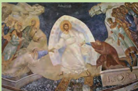
Ανάσταση, Μονή της Χώρας – Μουσείο Καριγιέ, Κωνσταντινούπολη.