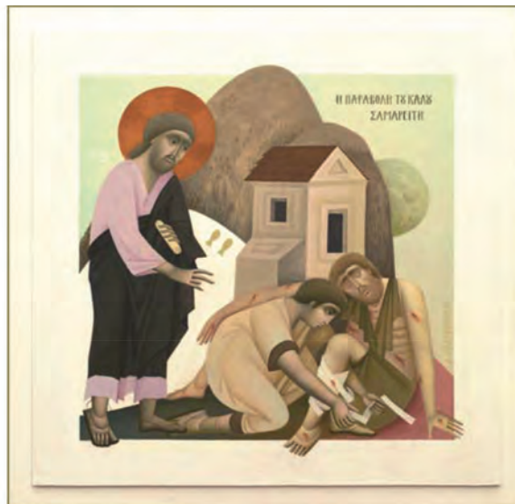
Εικόνα διά χειρός Φίκου. Η παραβολή του καλού Σαμαρείτη.