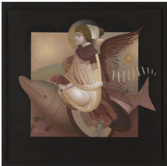
Έργο του Φίκου. Μούσα. Αυγοτέμπερα σε χειροποίητο ιαπωνικό χαρτί κολλημένο σε ξύλο.