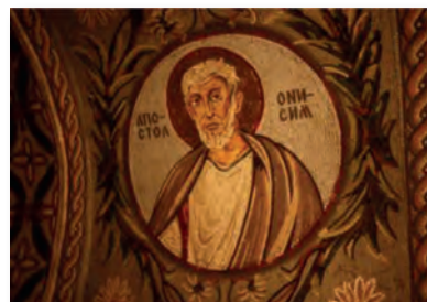
4. Άγιος Ονήσιμος, St. Petka Chapel, Βελιγράδι (ψηφιδωτό).

Στην περίπτωση του Ονήσιμου δεν ξέρουμε με ποιες συνθήκες έγινε η συνάντησή του με τον Παύλο στη φυλακή. [...] Ίσως τα πράγματα συνέβησαν ως εξής: Μετά την απομάκρυνση του από το σπίτι του Φιλήμονα, άρχισε να αντιμετωπίζει τα γνωστά προβλήματα που είχαν οι φυγάδες και σε δεινή θέση βρισκόμενος πληροφορήθηκε στην Έφεσο (όπου υπήρχε και το ιερό της Άρτεμης για τους δραπέτες) για τον φυλακισμένο απόστολο, για τον οποίο θα είχε ακούσει να γίνεται λόγος στο σπίτι του Φιλήμονα. Έτσι ίσως μετανιωμένος κατέφυγε στον Παύλο, δέχθηκε το κήρυγμά του και αποφάσισε να μεταβάλει ριζικά τη ζωή του. Ο Παύλος βρήκε στον Ονήσιμο ένα πολύτιμο, χρήσιμο ("εύχρηστο" κατά τη σημασία άλλωστε και του ονόματος του) βοηθό στα δεσμά του ευαγγελίου, δεν τον κράτησε όμως κοντά του, παρόλο που θα το ήθελε, αλλά τον έστειλε πίσω στον Φιλήμονα εφοδιασμένο και με το συστατικό γράμμα. Ήταν για τον απόστολο μια καλή ευκαιρία να δείξει και έμπρακτα τη διδασκαλία του ότι για τους πιστούς δεν υπάρχει διάκριση δούλου και ελεύθερου. [...]