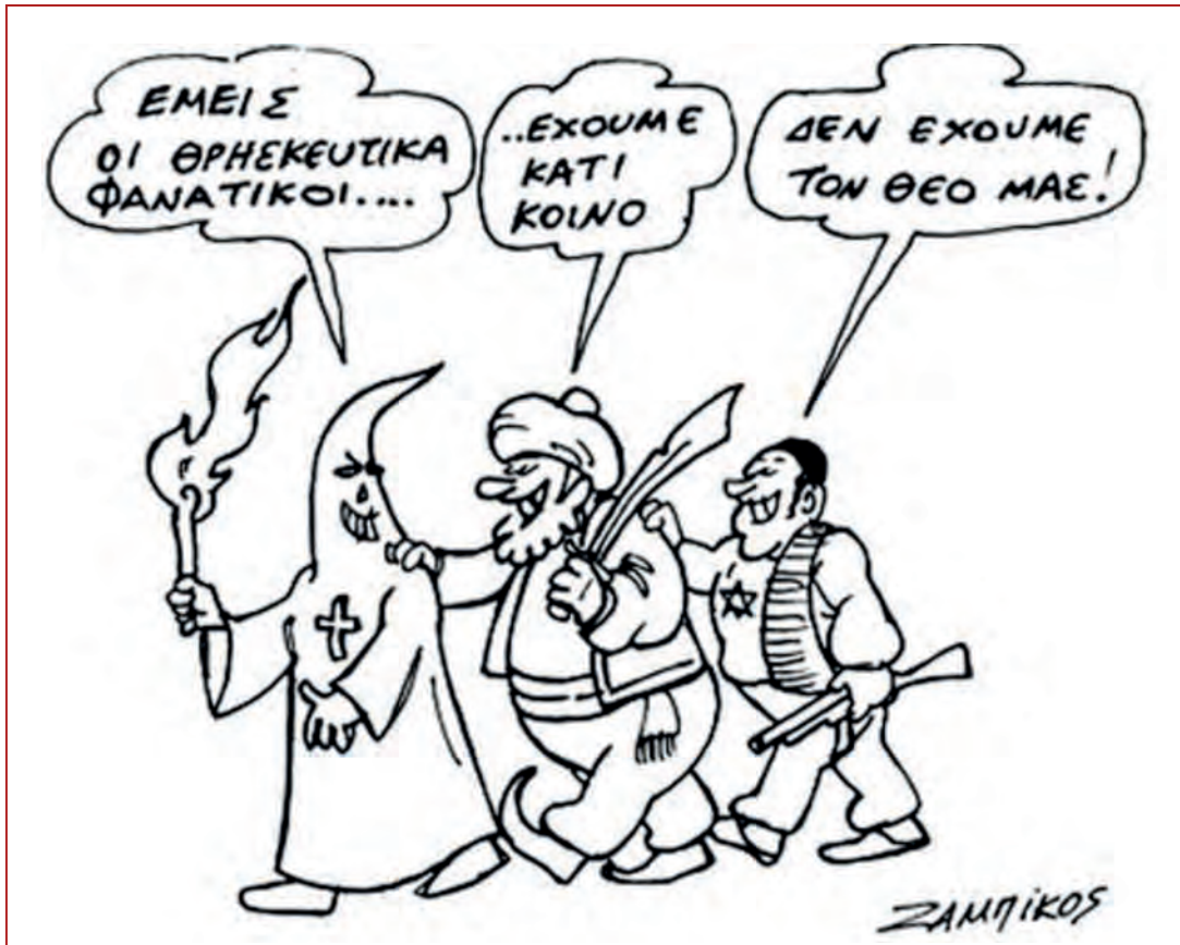
1. Ζαμπίκος, Μ., Θρησκευτικός φανατισμός (2010).