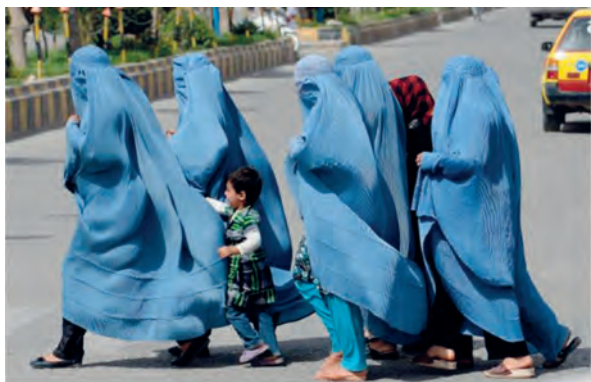
1. Γυναίκες στο Αφγανιστάν