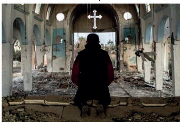
5. Δικαίωμα ...