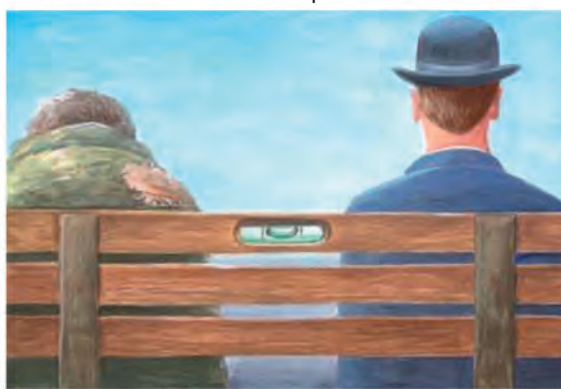
6. Δικαίωμα ...