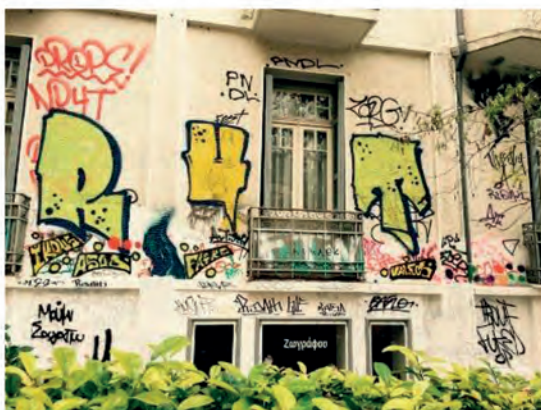
7. Δικαίωμα ...