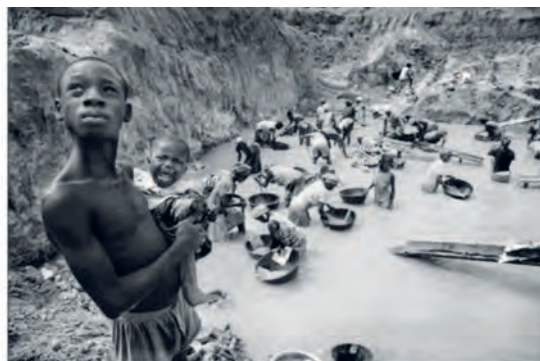
2. Εργασία στα χρυσορυχεία της Γκάνα