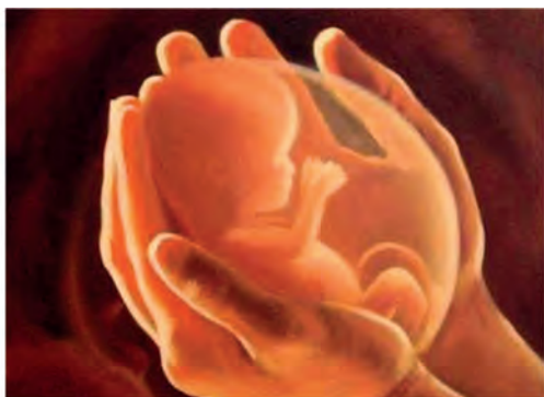
3. Δικαίωμα ...