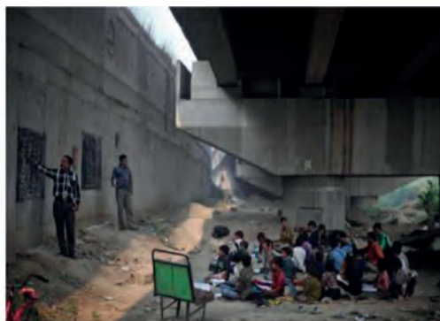
4. Δικαίωμα ...