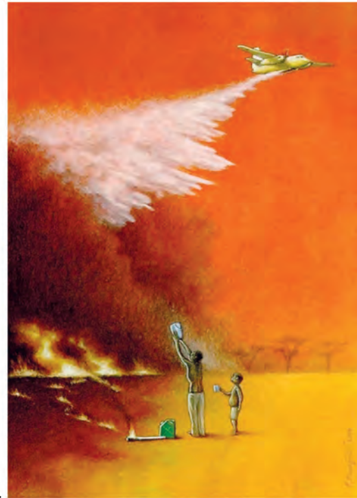
Pawel Kuczynski, Fire