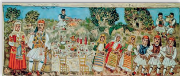
10. Έργο Θεόφλου

Και στις νύχτας το λαμπάδιασμα να πυκνώνει ο δεσμός μας και να σμίγει παλιές κι αναμμένες τροχιές με το ροκ του μέλλοντός μας