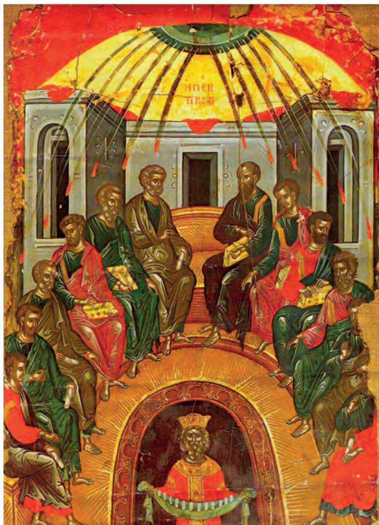
14. Θεοφάνης ο Κρης (1546). Κυριακή της Πεντηκοστής . Ι. Μονή Σταυρονικήτα, Άγιο Όρος.