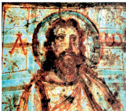
4. Το Άλφα και το Ωμέγα, Κατακόμβη της Δομιτίλλας, Ρώμη, 5 ος αι.

α. εκκλησία: (ετυμολογία) αρχ. < ἔκκλητος < ἐκκαλῶ «καλώ έξω, συγκαλώ» < ἐκ- + καλῶ. Η λ. αναφερόταν αρχικά στην Εκκλησία τού Δήμου, καθώς και στις συγκεντρώσεις των υπευθύνων μιας πόλης-κράτους, οι οποίες λειτουργούσαν ως νομοθετικά σώματα.