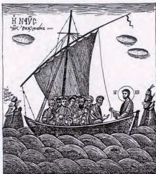
1. Η εκκλησία ως «ναυς», σχέδιο Ράλλη Κοψίδη (1957)