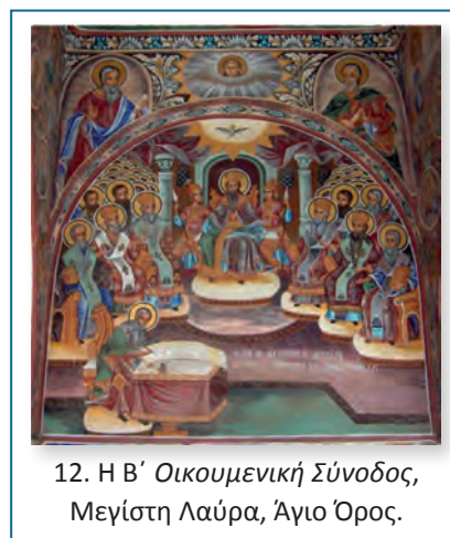
12. Η Β΄ Οικουμενική Σύνοδος, Μεγίστη Λαύρα, Άγιο Όρος.