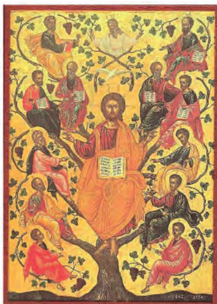
3. Η άμπελος