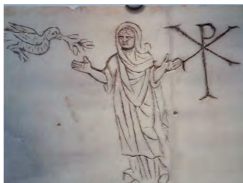
9. Εθνικό Ρωμαϊκό Μουσείο, Θέρμες Διοκλητιανού, Ρώμη

ε) Ιω 15, 5 : «Εγώ είμαι το κλήμα (« ἄμπελος »), εσείς οι κληματόβεργες (« τά κλήματα »). Εκείνος που μένει ενωμένος μαζί μου κι εγώ μαζί του, αυτός δίνει άφθονο καρπό, γιατί χωρίς εμένα δεν μπορείτε να κάνετε τίποτε».