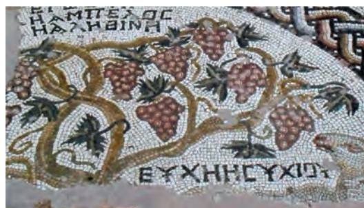
7. Ψηφιδωτό δάπεδο. Πάφος, Ναός Χρυσοπολίτισσας, Αναπαράσταση αμπέλου.

γ3) Το περιστέρι με κλαδί ελιάς στο ράμφος του, σύμβολο του πιστού μέσα στη χαρά του Παραδείσου.