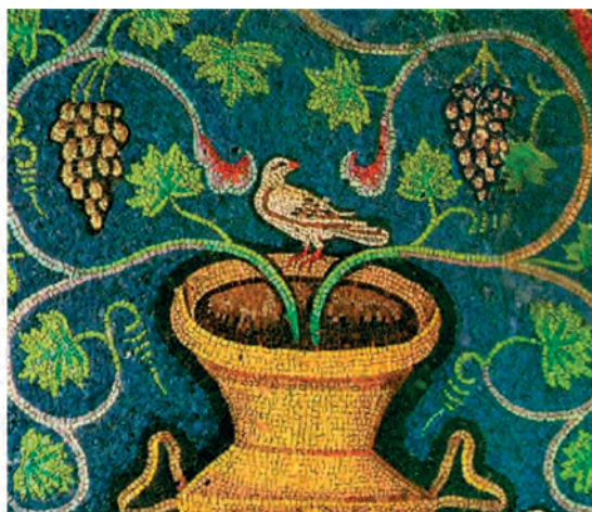
2. Άμπελος, ψηφιδωτό (λεπτομέρεια) από τη Βασιλική του Αγ. Βιταλίου, Ραβέννα, (6 ος αι.)