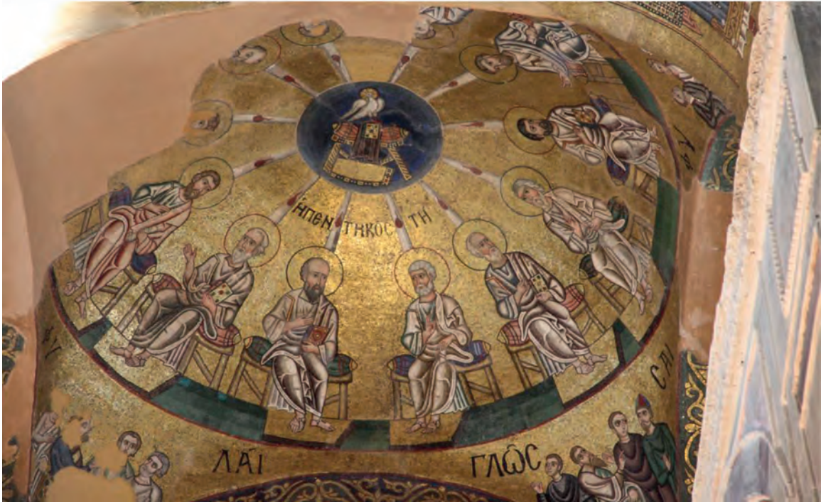
13. Πεντηκοστή, ψηφιδωτό από το Καθολικό της Ι. Μ. Οσίου Λουκά Βοιωτίας (11ος αι.)

Ονομάζεται λοιπόν η Εκκλησία καθολική, γιατί απλώνεται σε όλη την Οικουμένη, από τη μια ως την άλλη άκρη της γης· λέγεται καθολική, γιατί διδάσκει και ορθόδοξα και ασταμάτητα όλα τα δόγματα που πρέπει να γνωρίσουν οι άνθρωποι, για τα ορατά και τα αόρατα πράγματα, για τα επουράνια και τα επίγεια· (λέγεται καθολική), επειδή επιδιώκει να οδηγήσει στην ευσέβεια ολόκληρο το γένος των ανθρώπων, δηλαδή και τους άρχοντες και τους αρχόμενους, και τους μορφωμένους και τους απλοϊκούς· επίσης (λέγεται καθολική), γιατί γιατρεύει πέρα για πέρα και θεραπεύει όλα τα είδη των αμαρτιών που γίνονται με την ψυχή και το σώμα, καθώς και γιατί μέσα σ' αυτή αποκτάει κανείς κάθε είδος της λεγόμενης αρετής, που φαίνεται και στα έργα και στα λόγια και στα διάφορα πνευματικά χαρίσματα. Εκκλησία ακόμη ονομάζεται σύμφωνα με την κύρια σημασία της λέξεως «εκκλησία», γιατί καλεί όλους και τους μαζεύει.