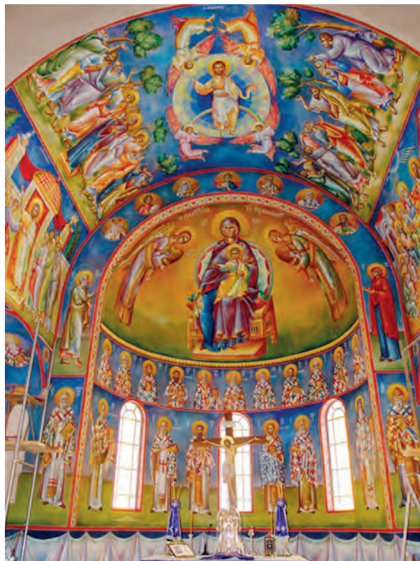
Από το παρεκκλήσιο του Αγίου Νεκταρίου (Ι. Ν. Αγ. Παντελεήμονος Γλυφάδας). Αγιογράφιση π. Σταμάτη Σκλήρη.

Μοναχός Μωυσής Αγιορείτης, (2008). Χριστός χριστιανούς χαρά χαρίζει . Αθωνικά Άνθη 13. Αθήνα: Τήνος, σ. 34-49.