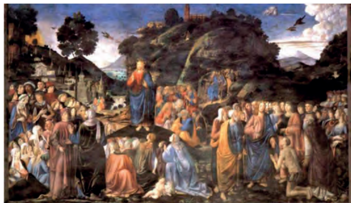
Cosimo Rosselli (1482). Η επί του Όρους ομιλία . Νωπογραφία. Cappella Sixtina (Βατικανό).

- 6, 1. 3: «Να προσέχετε την ελεημοσύνη σας, να μη γίνεται μπροστά στους ανθρώπους, με σκοπό να σας επιδοκιμάσουν. [...] Εσύ, αντίθετα, όταν δίνεις ελεημοσύνη, ας μην ξέρει ούτε το αριστερό σου χέρι τι κάνει το δεξί σου».