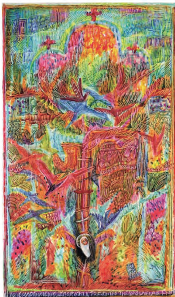
Ολυμπιάς Κελαϊδή, Το ευλογημένο σποράκι. Λαδοπαστέλ σε χαρτί.