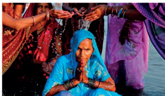
8. Τελετή στον ποταμό Γάγγη