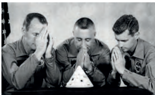
6. Το πλήρωμα του Αρollo 1 προσεύχεται