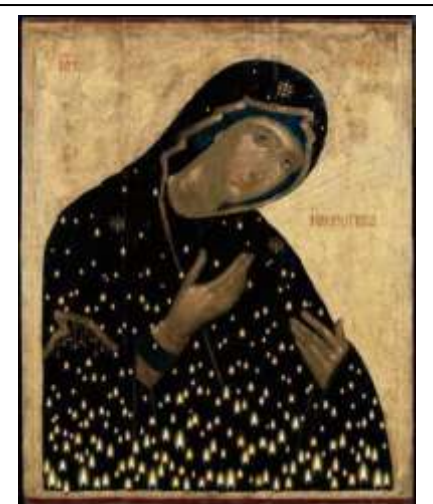
Χρ. Μποκόρος, Κεριώτισσα (2013)

Λίγα λόγια του ζωγράφου για το έργο του: