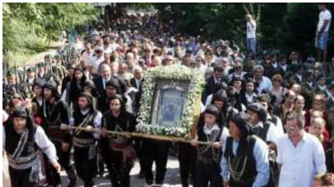
Περιφορά εικόνας Παναγίας Σουμελά.