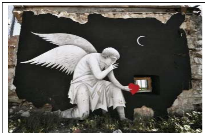
Φίκος, Wasted Love, 2014, graffiti Πειραιάς,

http://fikos.gr/portfolio/wasted-love-project-vol2/?lang=Gr