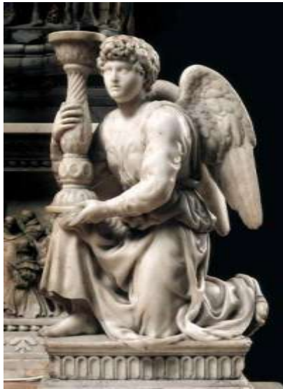
Μιχαήλ Άγγελος, Άγγελος με κηροπήγιο, 1494, Βασιλική San Domenico, Bologna, Ιταλία.