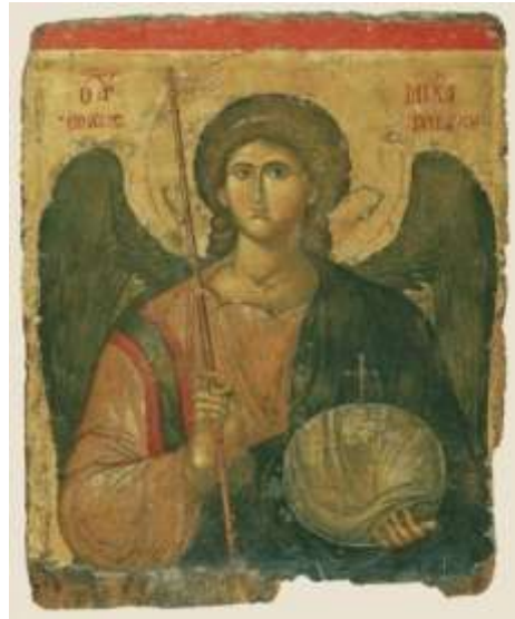
Ο Αρχάγγελος Μιχαήλ, φορητή εικόνα, 14 ος αι. Βυζαντινό και Χριστιανικό Μουσείο Αθηνών.