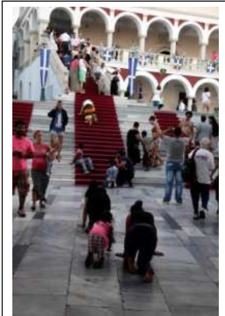
Προσκύνημα στην Παναγία της Τήνου