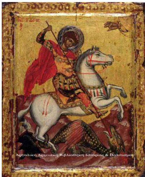
Εικόνα Αγίου Γεωργίου

Υπάρχουν άγιοι στην ορθοδοξία που οι θρύλοι οι οποίοι τους συνοδεύουν φανερώνουν την ιδιαίτερη σχέση και αγάπη των πιστών προς αυτούς, σχέση που τους εκτείνει πέρα από τα όρια του δόγματος και της θρησκείας, τους καθιστά περισσότερο οικείου και οικουμενικούς.