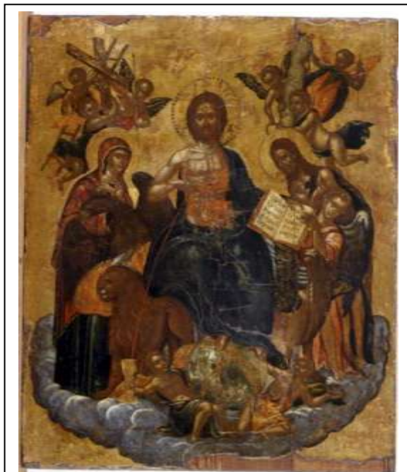
Μιχαήλ Δαμασκηνός, Η αλληγορία της Θείας Μετάληψης . Δεύτερο μισό του 16 ου αι. Βυζαντινό και Χριστιανικό μουσείο (Αθήνα).