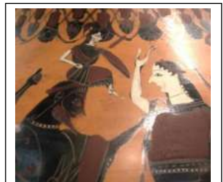
Η γέννηση της Αθηνάς. Λούβρο

Η Αθηνά ήταν η αγαπημένη κόρη του Δία. Μητέρα της ήταν η Μήτις, πρώτη σύζυγος του Δία. Ο Δίας ύστερα από προφητεία έμαθε ότι η Μήτις θα γεννούσε παιδί το οποίο θα ανέτρεπε από την εξουσία τον πατέρα του, οπότε την κατάπιε ενώ ήταν έγκυος στην Αθηνά. Αργότερα, ο Δίας άρχισε να υποφέρει από πονοκεφάλους και κάλεσε τον Ήφαιστο να τον βοηθήσει. Τότε ο Ήφαιστος με ένα μεγάλο σφυρί χτύπησε το κεφάλι του Δία και πετάχτηκε η Αθηνά πάνοπλη, φορώντας περικεφαλαία και κρατώντας μια ασπίδα. Βλέποντας τον Δία, τα πέταξε στα πόδια του,