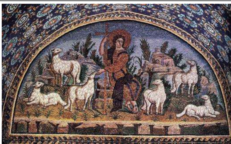
«Ο Καλός Ποιμένας», ψηφιδωτό από το μαυσωλείο της Γάλα Πλακιδία στη Ραβένα, 425 μ.Χ.