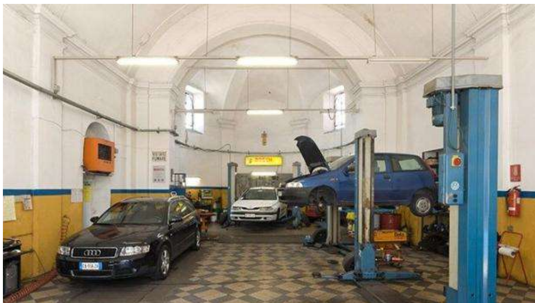
Ταυτότητα έργου: Εκκλησία στο Κόμο, Ιταλία, που έχει μετατραπεί σε συνεργείο αυτοκινήτων