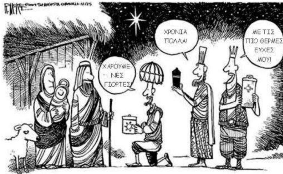
ΑΦΟΥ ΦΥΓΑΝ ΟΙ ΤΡΕΙΣ ΜΑΓΟΙ, ΗΛΘΑΝ ΟΙ ΤΡΕΙΣ ΠΟΛΙΤΙΚΑ ΟΡΘΟΙ ΤΥΠΟΙ

Ταυτότητα έργου: Γελοιογραφία για την πολιτική ορθότητα των Χριστουγέννων