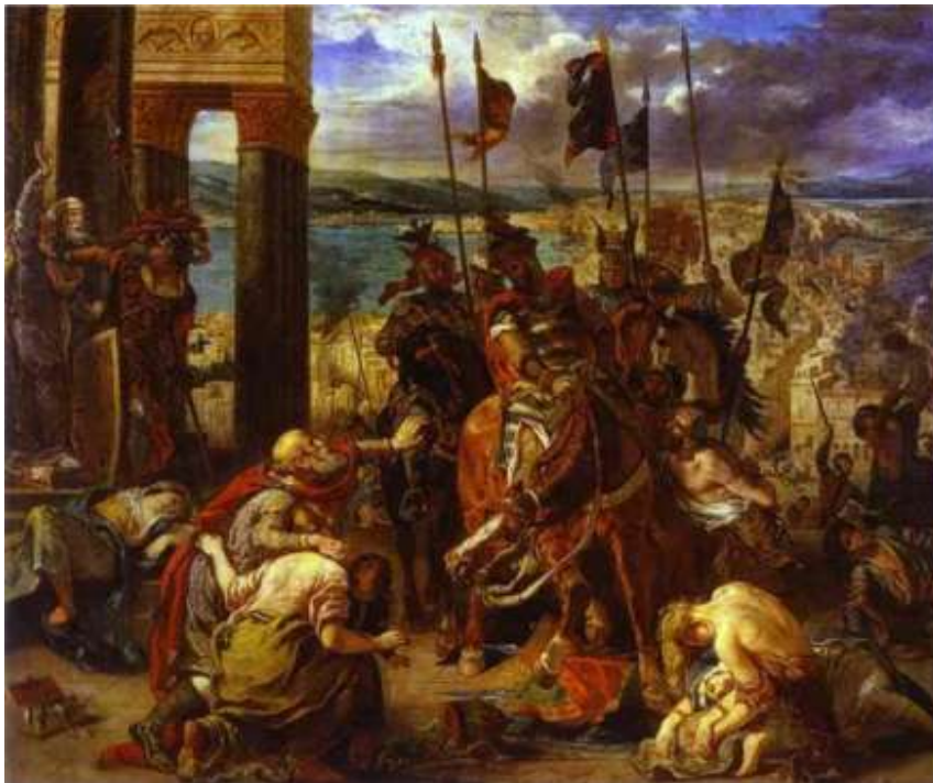
Delacroix, 1840, Η είσοδος των Σταυροφόρων στην Κωνσταντινούπολη , Μουσείο Λούβρου.