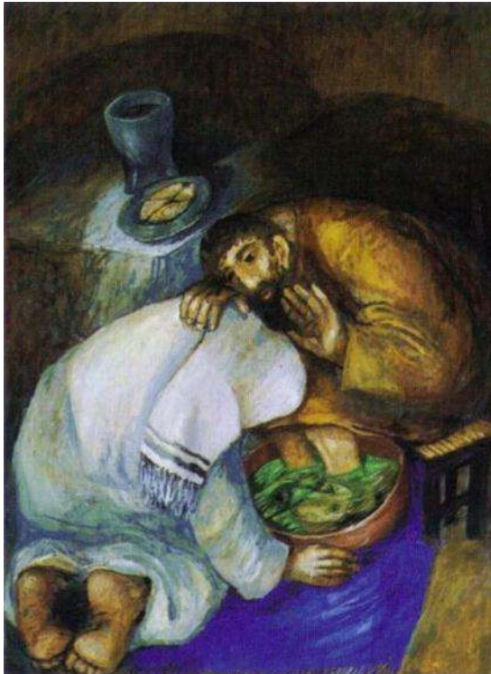
Ταυτότητα έργου: Ο Ιησούς πλένει τα πόδια του Πέτρου, Sieger Koder