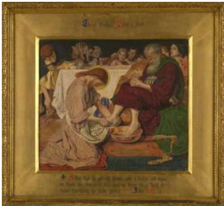
Ταυτότητα έργου: Ο Ιησούς πλένει τα πόδια του Πέτρου, Ford Madox Brown 1857–8