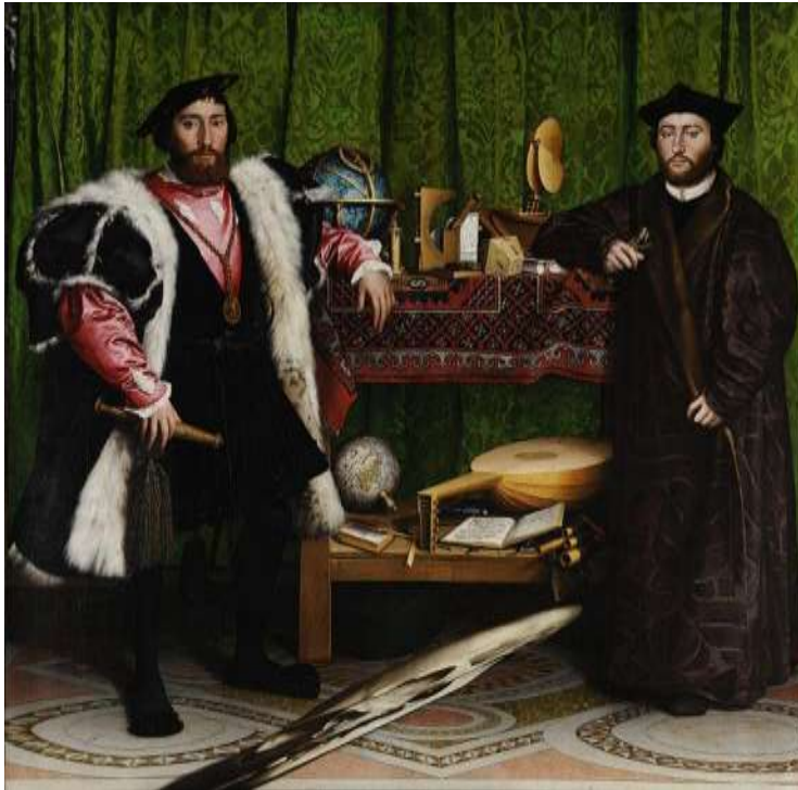
Hans Holbein, «The Ambassadors».