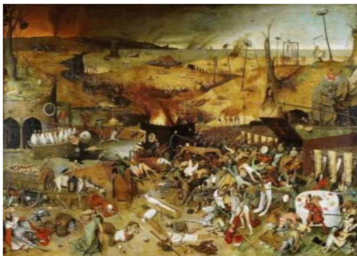
Pieter Bruegel, «The Triumph of Death». Ανακτήθηκε από https://en.wikipedia.org/wiki/The_Triumph_of_Death (9/9/2016).