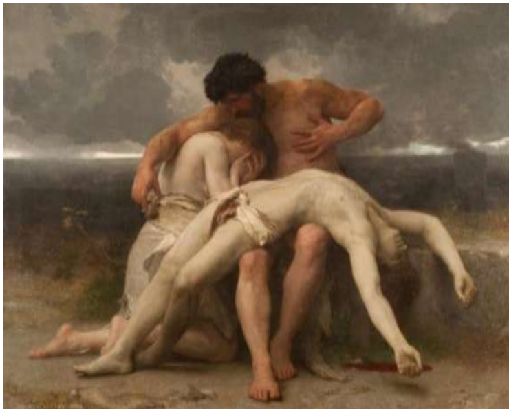
William-Adolphe Bouguereau, «The first mourning». Ανακτήθηκε από https://en.wikipedia.org/wiki/The_First_Mourning (8/9/2016).