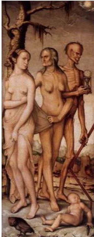
Hans Baldung Grien, «The three ages of man and death».