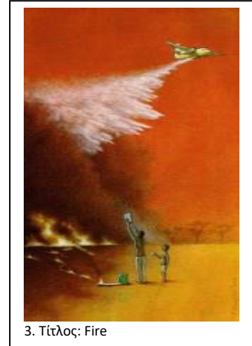
3. Τίτλος: Fire