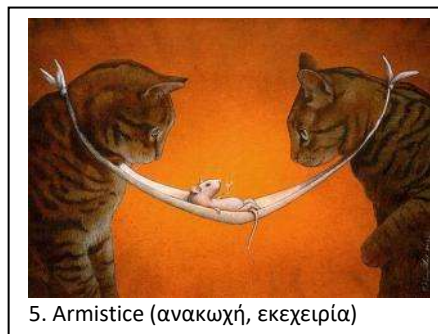
5. Armistice (ανακωχή, εκεχειρία)

Ή σε συνδυασμό αυτές οι δύο γελοιογραφίες (άλλων καλλιτεχνών):