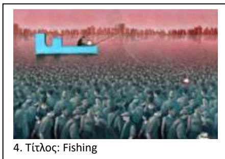
4. Τίτλος: Fishing