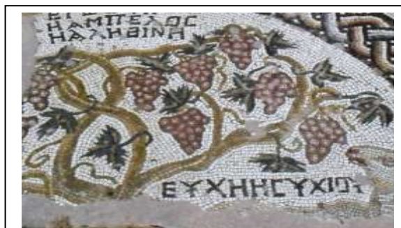
Ψηφιδωτό δάπεδο. Κύπρος, Πάφος, Ναός Χρυσοπολίτισσας, Αναπαράσταση αμπέλου.