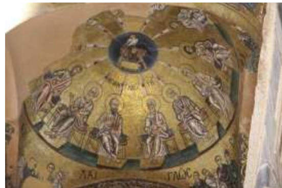
Ψηφιδωτό από το Καθολικό της Ι. Μ. Οσίου Λουκά Βοιωτίας (του 11ου αι.):

http://photodentro.edu.gr/v/item/ds/8521/4637