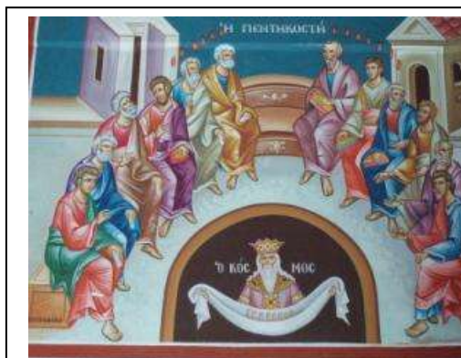
Συλλογή εικόνων: Πεντηκοστή:

http://photodentro.edu.gr/v/item/ds/8521/4637