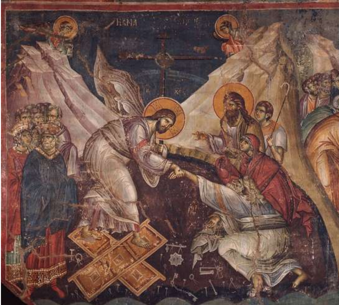
Η εικόνα της Ανάστασης του Χριστού («εις Άδου κάθοδος» Μαν. Πανσέληνου, Πρωτάτο Αγίου Όρους).