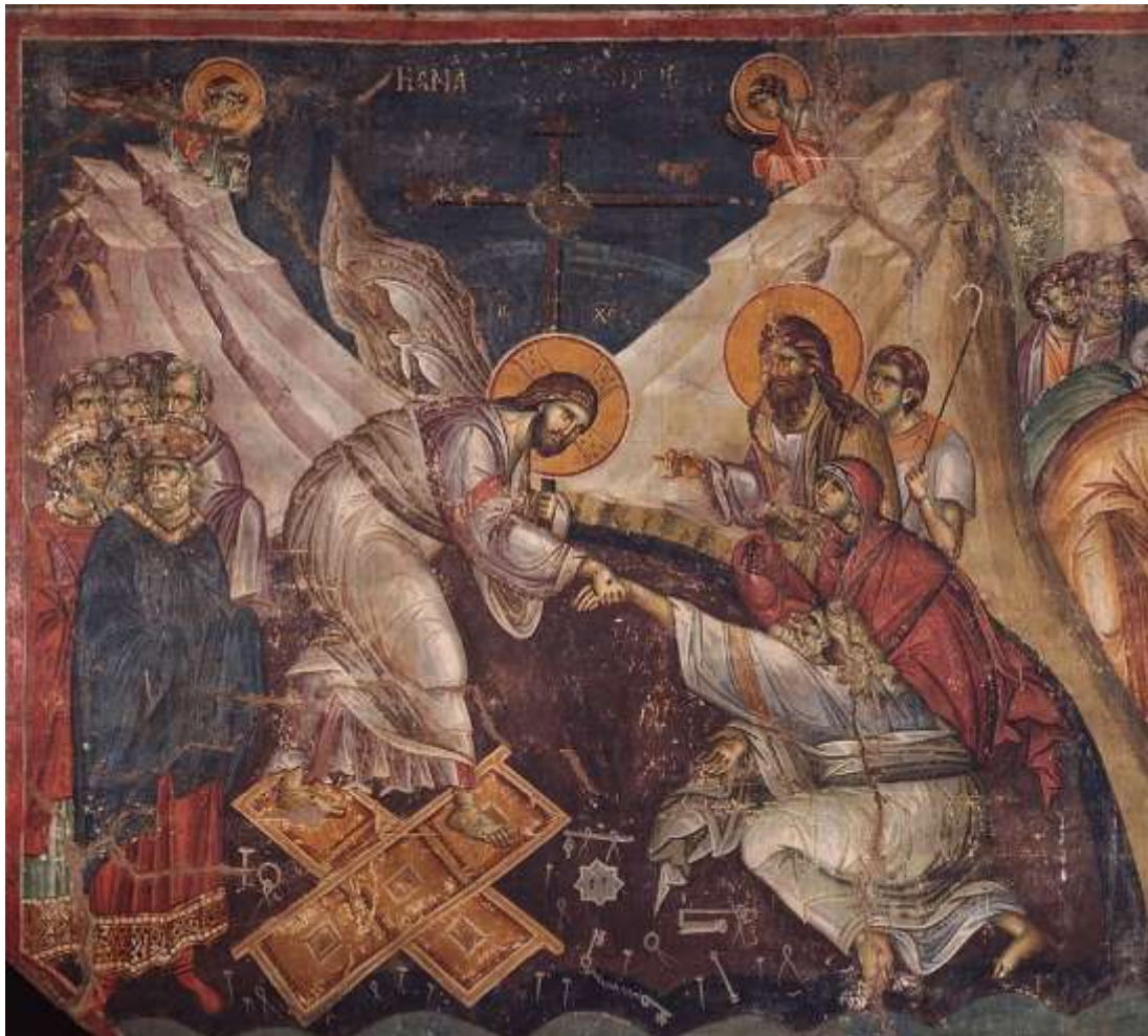
Η εικόνα της Ανάστασης του Χριστού («εις Άδου κάθοδος» Μαν. Πανσέληνου, Πρωτάτο Αγίου Όρους).