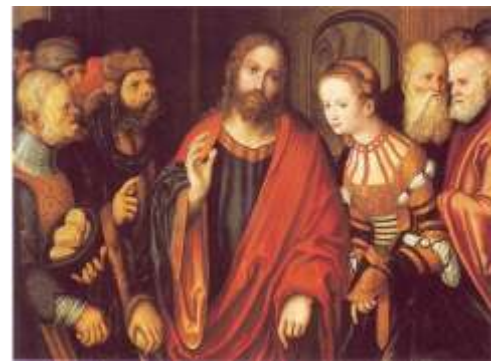
Lucas Cranach the Elder, Ο Χριστός και η μοιχαλίδα (1520)