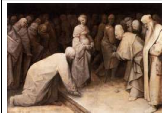
Pieter Bruegel the Elder (Πέτερ Μπρέγκελ Πρεσβύτερος), Ο Χριστός και η μοιχαλίδα (1565)