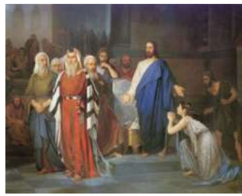
Isaak Asknazi, Η μοιχαλίδα ενώπιον του Χριστού (19 ος αι.)