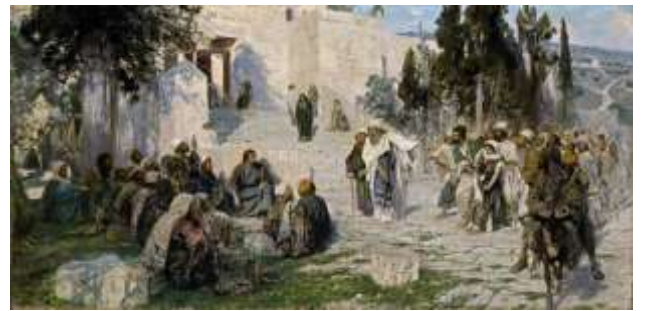
Vasily Polenov, He that is without sin... (Ο αναμάρτητος...) (1908)