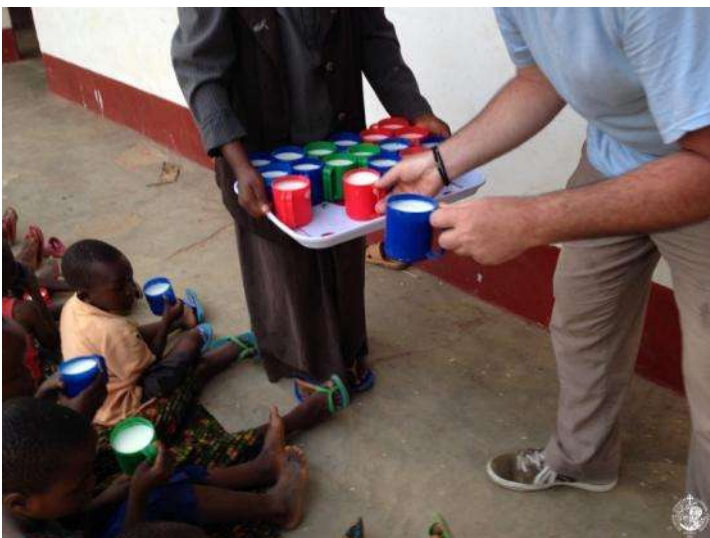
Ορθόδοξη ιεραποστολή στην Τανζανία.