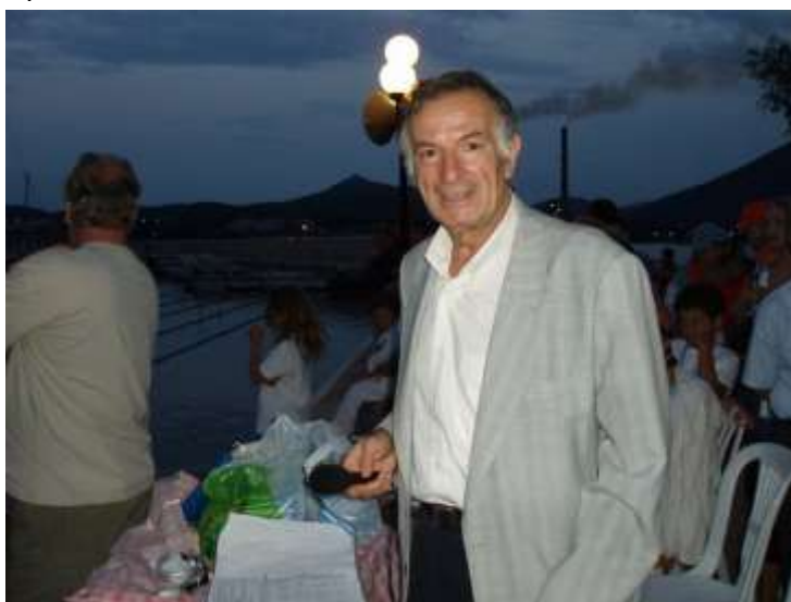
Επί χρόνια πρόεδρος του ΝΟΑ ήταν ο αείμνηστος Σταμάτης Αλέξης