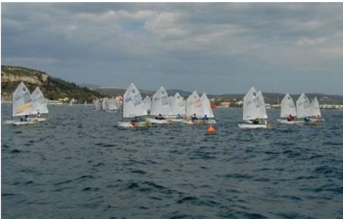
Στη φωτο κάτω στιγμιότυπο από τους αγώνες