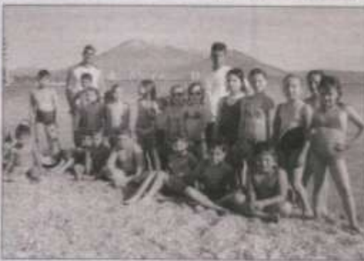
Το μερπύ Αλιβερίου του Ν.Ο. Αλιβερίου μαζί με τους προπονητές τους.