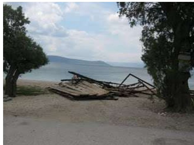
Νέες πλωτές εξέδρες 24/06/2011