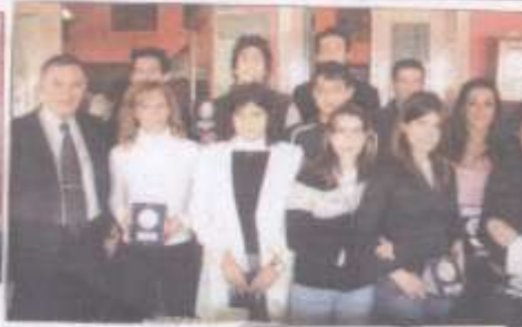
Οι αθλήτριες και άσπαστρον με το χρυσό μετάλλιο του Ομίλου Στίβου Αλιβερίου.

ΒΑΡΕΘΗΚΑΝ Ν' ΑΚΟΥΝΕ ΥΠΟΣΧΕΣΕΙΣ ΣΤΟ ΑΛΙΒΕΡΙ