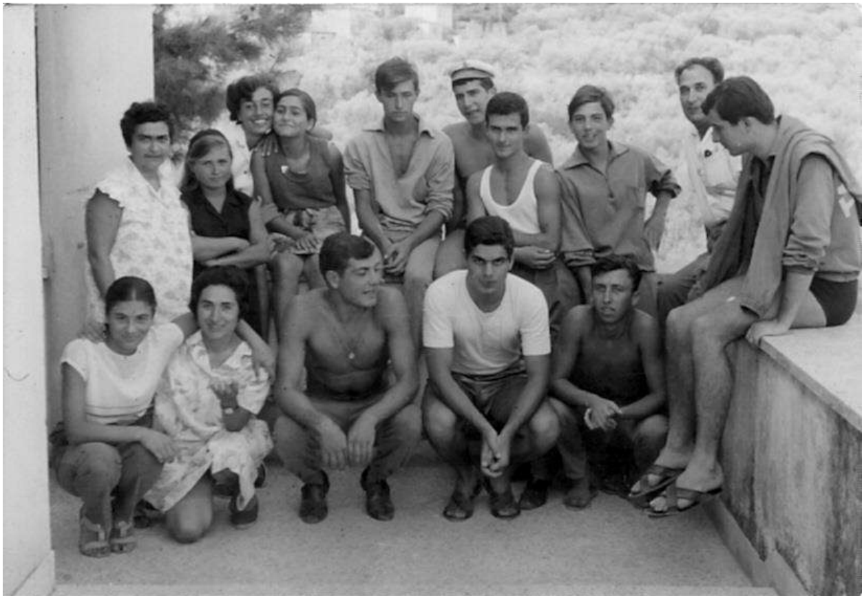
Πανεπαρχιακοί Ναυτικοι Αγώνες στη Καβάλα 30-6-1969

Το μέγα πρόβλημα που συνεχίζει να υπάρχει μέχρι σήμερα.