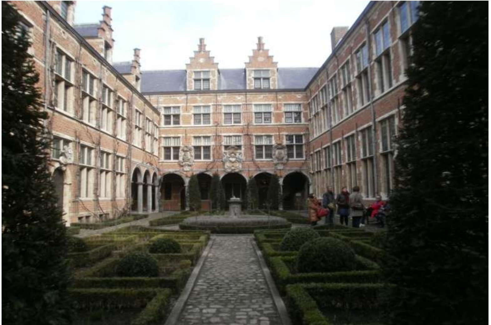
The Plantin-Moretus Museum