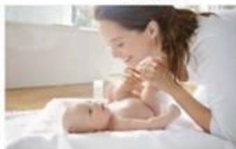
Φροντίζει το παιδί της