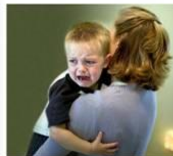
Το αγκαλιάζει! Του παρέχει ασφάλεια !