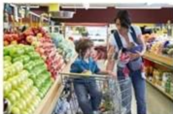
Πηγαίνει για ψώνια με το παιδί της