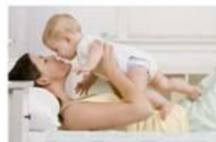
Δείχνει την αγάπη της