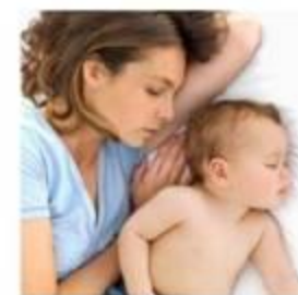
Κοιμάται δίπλα του μερικές φορές