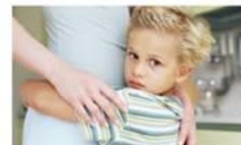
Παρηγορεί το παιδί της, [που φοβάται]