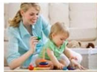
Παίζει μαζί του