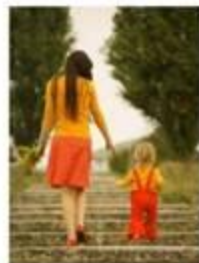
Πηγαίνει βόλτα με το παιδί της