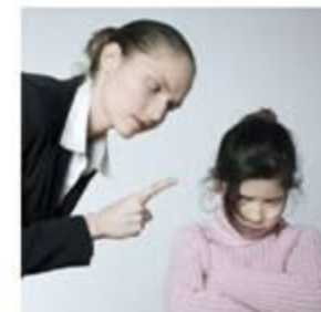
Το μαλώνει, όταν πρέπει ...