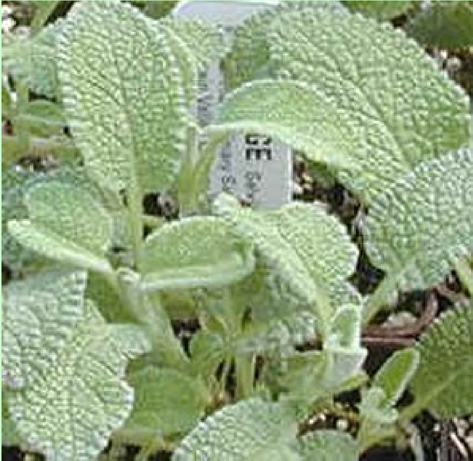
Salvia fruticosa (Φασκόμηλο)

Λόγω των διεγερτικών του ιδιοτήτων, το φασκόμηλο πιστεύεται ότι θα πρέπει να αποφεύγεται από άτομα υπερτασικά.