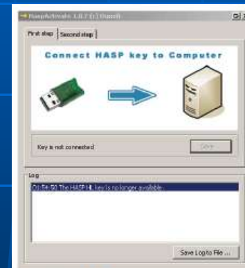
Εικόνα 4.3. Μήνυμα σύνδεσης HASP στον Η/Υ