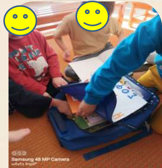
Τα παιδιά εξερευνούν τη βαλίτσα...