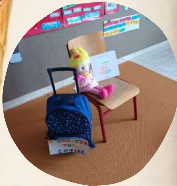
Η επισκέπτριά μας...