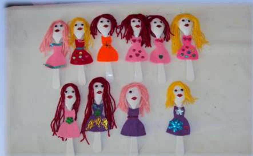
Και μια αναμνηστική φωτογραφία.