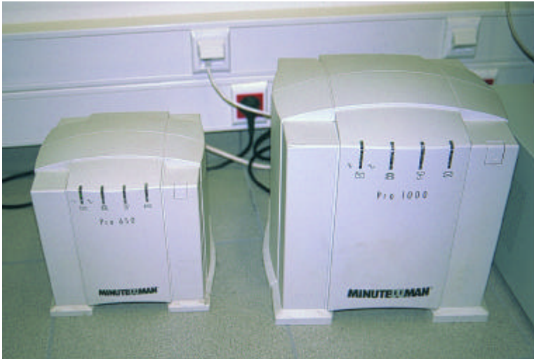
U.P.S. για την τροφοδότηση της εγκατάστασης της δομημένης καλωδίωσης

Τα modem (ετυμολογικά η λέξη προέρχεται από τα αρχικά των λέξεων modulator και demodulator ), είναι οι συσκευές που μετατρέ-