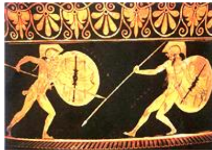
ΑΧΙΛΛΕΑΣ ΚΑΙ ΕΚΤΟΡΑΣ