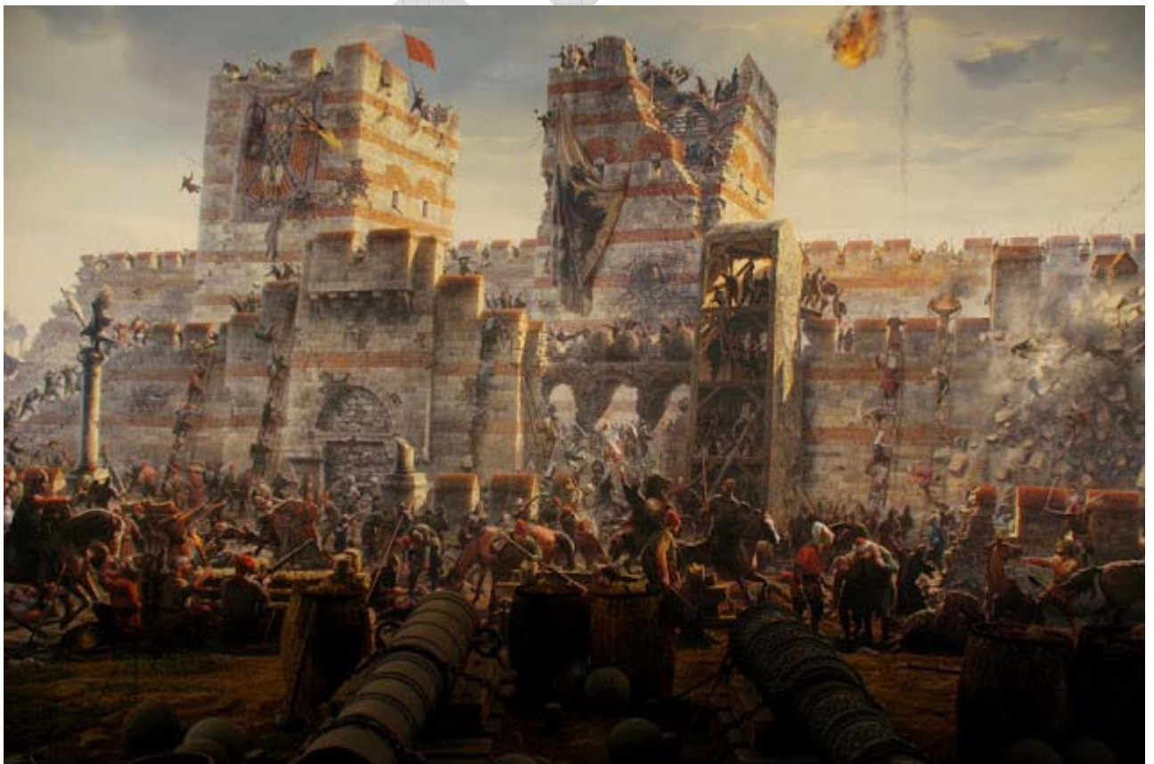
Στα βυζαντινά χρόνια – Στ' ενότητα «Το Βυζάντιο παρακμάζει & υποκύπτει σε κατακτητές»