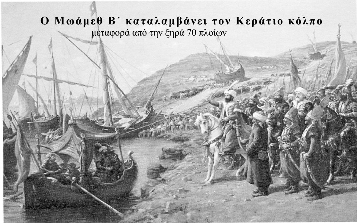
Ο Μωάμεθ Β΄ καταλαμβάνει τον Κεράτιο κόλπο μεταφορά από την ξηρά 70 πλοίων

Ο Μωάμεθ Β΄ κατάφερε με ένα έξυπνο και προσεκτικά μελετημένο σχέδιο τη μεταφορά του στόλου του στον Κεράτιο κόλπο χωρίς να γίνει αντιληπτός από τους αντιπάλους· στη φωτογραφία η «υπερνεώλκηση» του οθωμανικού στόλου σε ελαιογραφία του Ιταλού ζωγράφου της οθωμανικής Αυλής Fausto Zonaro (Ανάκτορο Ντολμά Μπαχτσέ, Κωνσταντινούπολη).