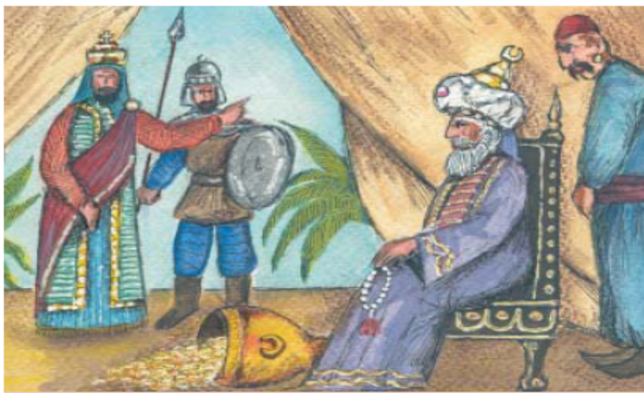
3.α. Οι Βυζαντινοί απορρίπτουν τις προτάσεις του Άραβα Χαλίφη της Βαγδάτης.