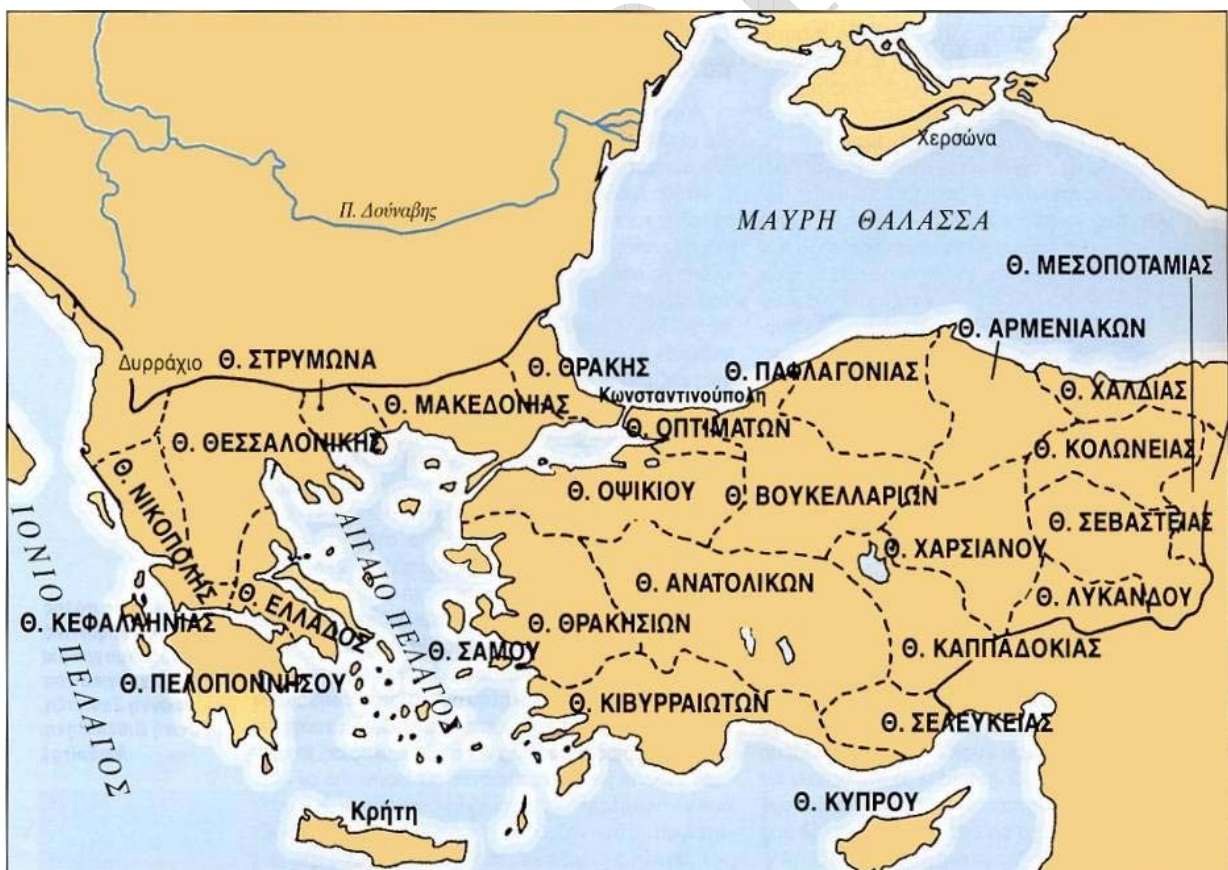
Θέματα της Βυζαντινής αυτοκρατορίας τον 10ο αιώνα

Στα βυζαντινά χρόνια – Ε' ενότητα « Η μεγάλη ακμή του Βυζαντινού κράτους»