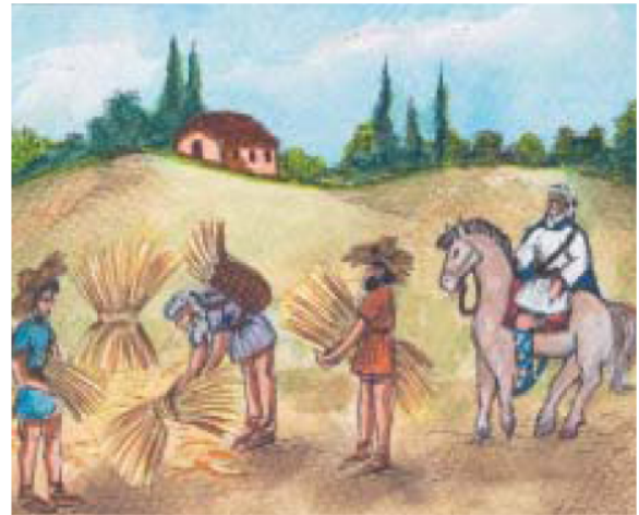
3. Δυνατός μεγαλοκτηματίας επιβλέπει το θερισμό των κτημάτων του.

Κωνσταντίνος Πορφυρογέννητος, Νεαρά (Μάρτιος 947 μ.Χ.)